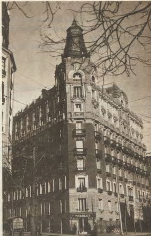
Nel piano rialzato di questo edificio, a Madrid, in via Luchana, ebbe sede l'Accademia DYA dalla fine del 1933 agli inizi dell'anno accademico 1934-1935.

In quegli anni, uno dei suoi apostolati più amati fu quello con studenti universitari, perché si rendeva conto che, dovendo giungere per precisa volontà di Dio a tutti gli strati della società, avrebbe potuto realizzare più rapidamente questo programma attraverso i giovani universitari. Conversava con loro per le vie di Madrid o li riuniva familiarmente in casa di sua madre. Quando poi, durante le vacanze, lasciavano la città, continuava questo lavoro per via epistolare. Ecco, per esempio, alcune righe di una lettera inviata a uno di quei giovani: Abbi con Gesù la più totale confidenza. Parlagli per quel che Egli è, un Amico del cuore. Raccontagli le cose tue e le nostre. Passaci tutti in rassegna: i vecchi e i nuovi..., e tutti quelli che devono venire, fino alla fine dei secoli. Sii certo che ti ascolta, perché questa è la verità. Riempiti di fede. Di fede e d'Amore. Invoca la Madonna e San Giuseppe, nostro Padre e Signore. Tratta sempre con affettuosa amicizia il tuo Angelo Custode. Tutto ciò è robusta e solida devozione. Se qualche volta (o molte volte) davanti al Tabernacolo ti senti freddo e arido, senza sapere che cosa dire a Gesù..., fagli la guardia: persevera come d'abitudine, senza togliere un minuto: fedele, come un