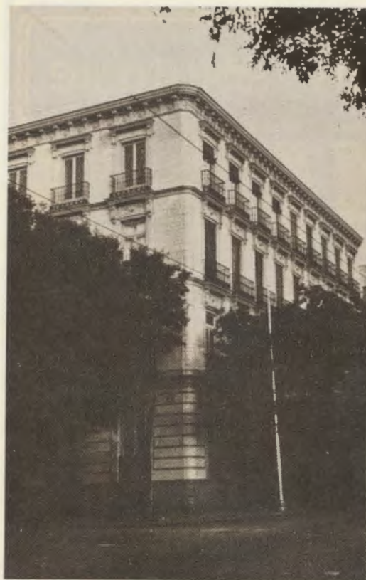
L'edificio di via Ferraz, n. 50 (Madrid), di cui la Residenza DYA utilizzò due appartamenti al penultimo piano, a partire dall'ottobre del 1934; l'Accademia si trovava in un altro appartamento, all'ultimo piano.