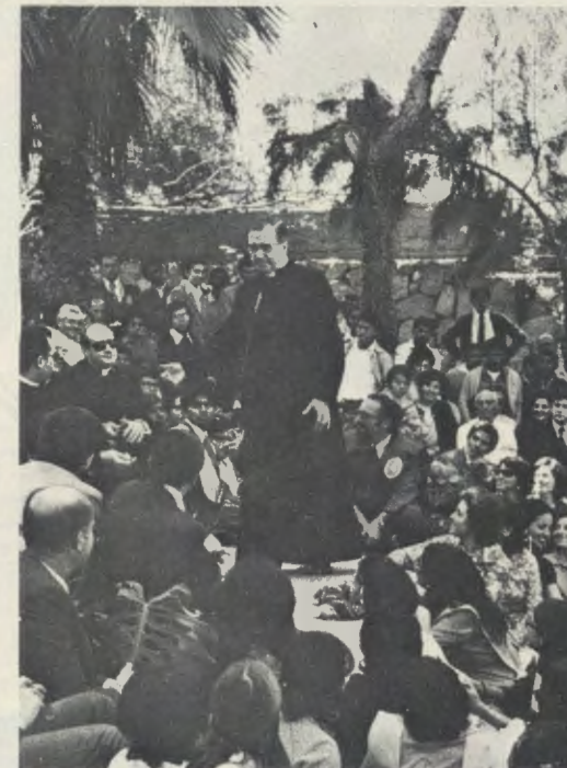
Il Servo di Dio a Larboleda, presso Lima, il 29 luglio 1974, nel corso di un incontro a cui parteciparono numerosi docenti e alunni dell'Università di Piura.

Sono parole che esprimono bene il costante incoraggiamento che il Fondatore dell'Opus Dei infuse a questa impresa universitaria. Con questo impulso è stato posto in opera un progetto educativo che risponde alle esigenze della regione e, in particolare, alla domanda di professionisti ben preparati. L'Università conta più di millecinquecento studenti, ripartiti per ora nelle Facoltà di Arti liberali, di Scienze dell'ingegneria, di Ingegneria industriale, di Scienze dell'informazione e di Amministrazione aziendale. Oltre ai corsi accademici ordinari, l'Università ha