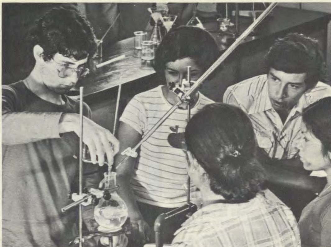
Il laboratorio di chimica.

gior parte degli studenti l'iscrizione è gratuita, in considerazione delle loro precarie condizioni economiche. L'Università fa appello, pertanto, alla generosità di molte persone a cui si aggiunge il lavoro che i laboratori di ingegneria offrono alle imprese.