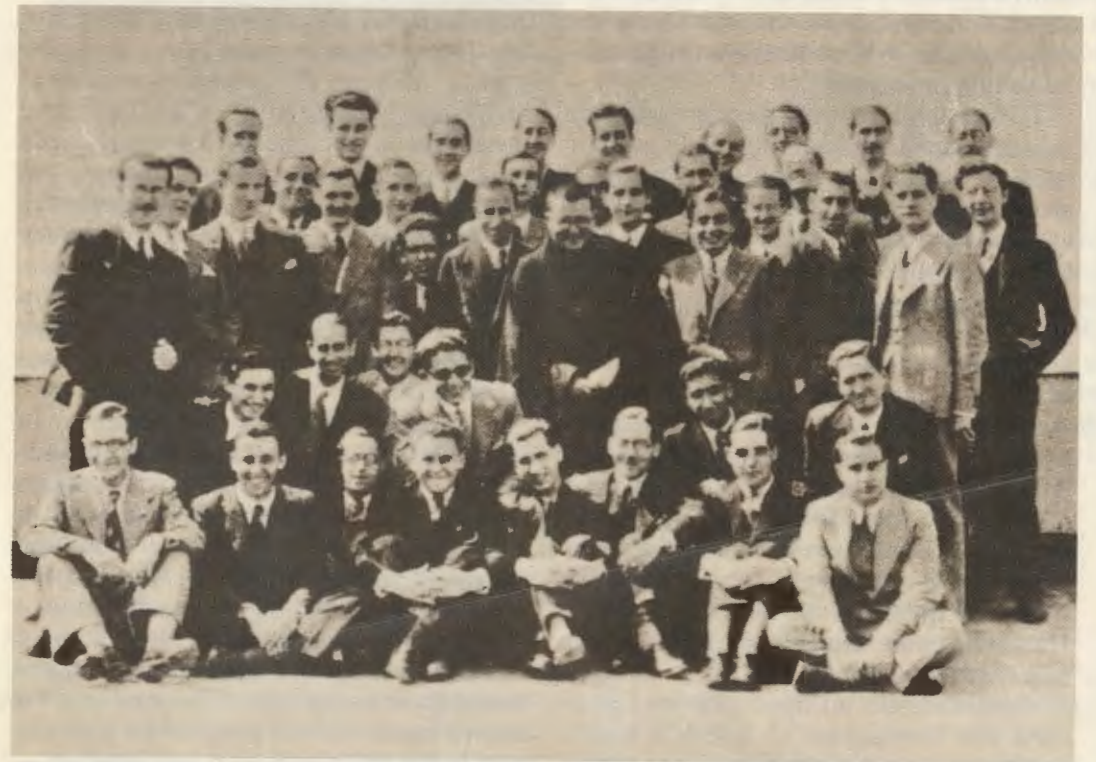
Il Servo di Dio con alcuni studenti dell'Accademia DYA.

Don Josemaría si diede a questo compito impegnandosi totalmente, dedicandovi grandi sforzi e moltissime ore. Insegnava a quei giovani a mantenere l'ordine, a far buon uso del tempo, a essere sempre contenti, a essere sinceri e devoti, ad amare il sacrificio che il compimento fedele del dovere porta con sé... In uno studiolo ammobiliato sobriamente, don Josemaría riceveva tutti coloro — tanti — che andavano da lui in cerca di consiglio e di orientamento. Da una parete pendeva una croce di legno, senza crocifisso; e lui spiegava, all'occasione, quello che poi