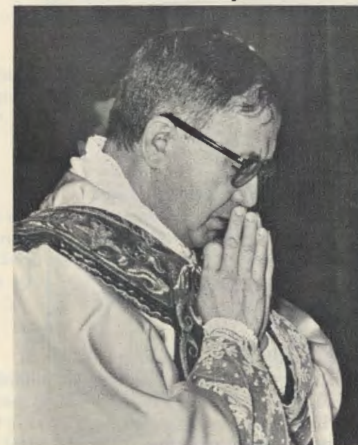
Il Fondatore dell'Opus Dei mentre celebra la Santa Messa (Roma, 21 marzo 1964).

Fin dai primi tempi del suo ministero sacerdotale, agli inizi dell'Opus Dei, il Servo di Dio chiamava la Santa Messa centro e radice della vita interiore . Il Sacrificio dell'Altare è la fonte e il vertice dell'esistenza cristiana, perché in questo olocausto è lo stesso Cristo — perfetto Dio e perfetto uomo — che si offre per noi al Padre e si dona a noi come alimento: La Santa Messa ci pone così di fronte ai misteri principali della fede, in quanto è