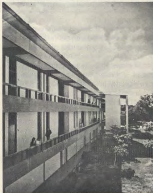
Un edificio dell'Università.

Piura è una bella città del Perù, capitale del dipartimento che porta il suo nome, situata a più di mille chilometri a nord di Lima. Di clima caldo e asciutto, la sua principale ricchezza è l'agricoltura, benché attualmente progetti di vasta portata la stiano tra-