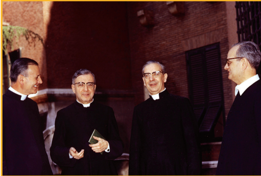
Los tres primeros sacerdotes del Opus Dei, el día del 25 aniversario de su ordenación, con San Josemaría.