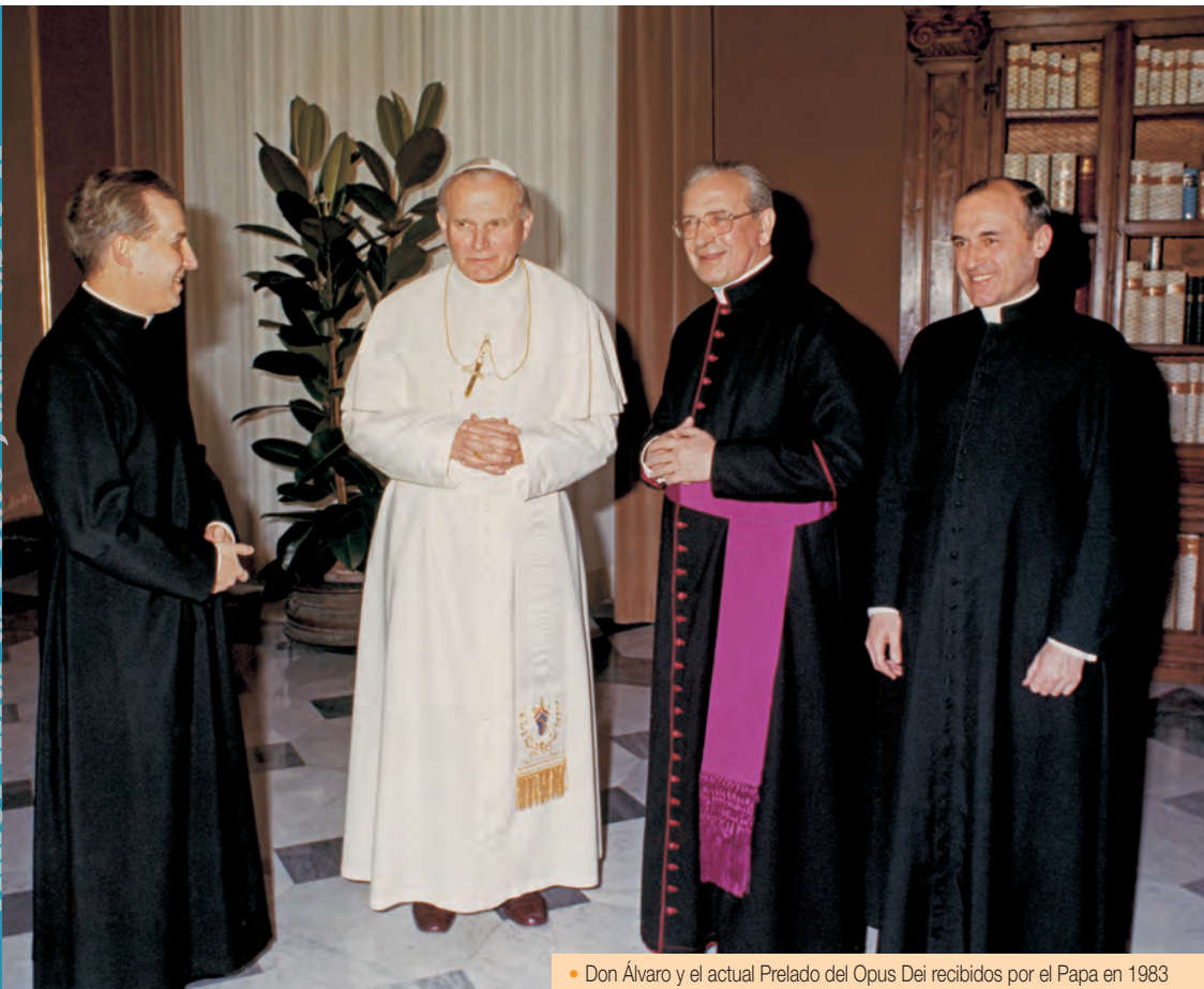
• Don Álvaro y el actual Prelado del Opus Dei recibidos por el Papa en 1983

Con fecha 28 de noviembre de 1982, el Santo Padre Juan Pablo II, mediante la Constitución apostólica Ut sit , erigió el Opus Dei como Prelatura personal y nombró Prelado a Mons. Álvaro del Portillo. El 6 de enero de 1991, le confirió la Ordenación episcopal en la Basílica de San Pedro. No se trataba solo de un reconocimiento hacia su persona, sino de algo muy congruente con la peculiar misión que corresponde al Prelado del Opus Dei en la Iglesia.