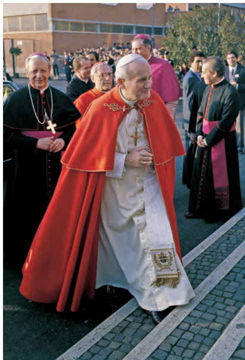
• Visita del Santo Padre al centro ELIS, Roma (1984)

Mons. Echevarría le agradeció en nombre del Opus Dei esa prueba de profunda benevolencia. El Beato Juan Pablo II contestó, en italiano, que lo consideraba un deber: “ Si doveva, si doveva ”, fueron sus palabras. ▲