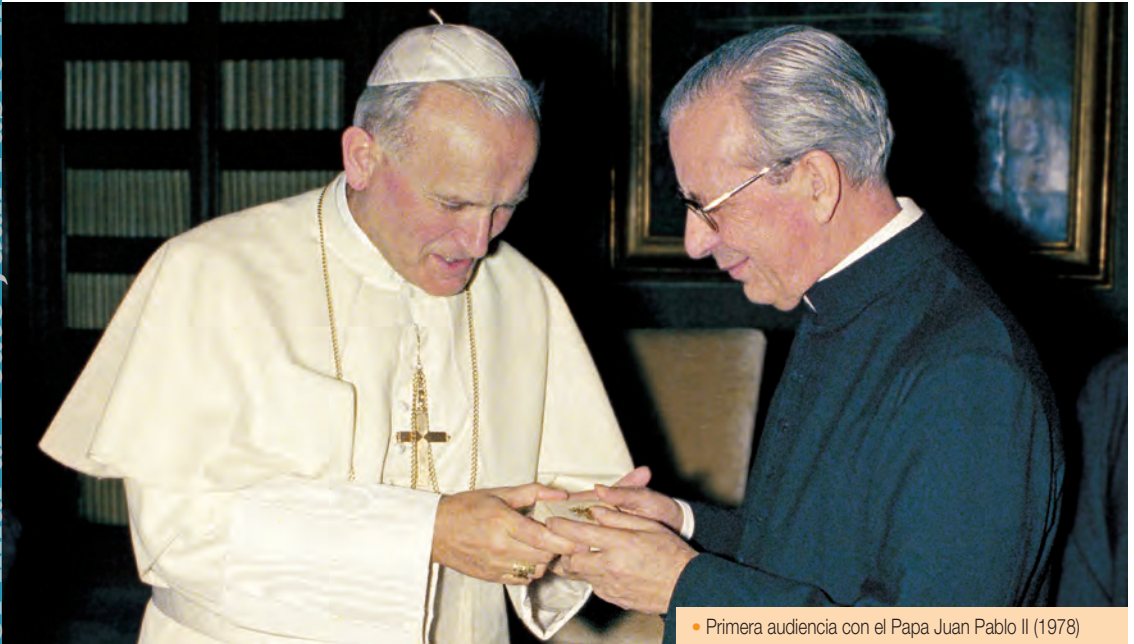
• Primera audiencia con el Papa Juan Pablo II (1978)