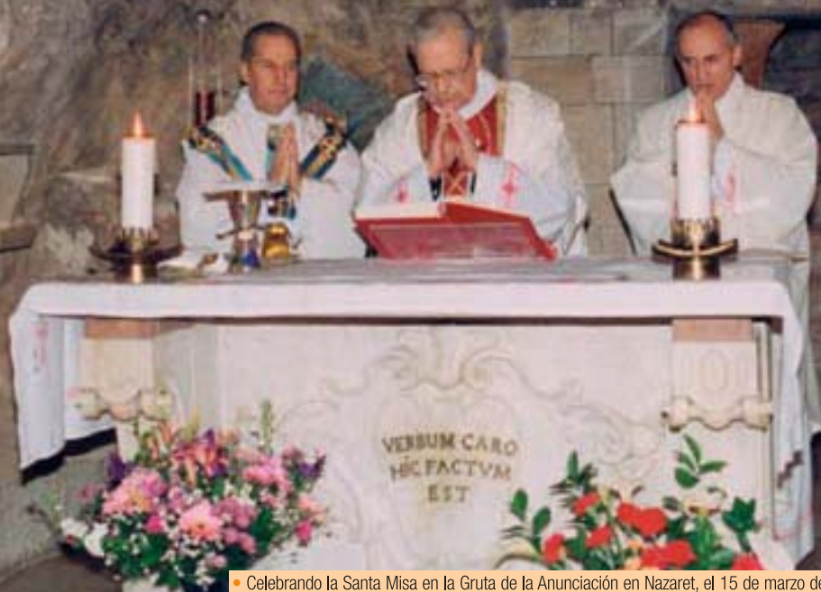
• Celebrando la Santa Misa en la Gruta de la Anunciación en Nazaret, el 15 de marzo de 1994