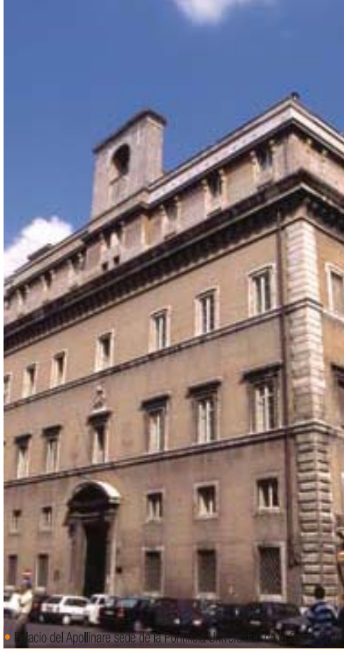
Edificio del Apollinare sede de la Pontificia Universidad de la Santa Cruz