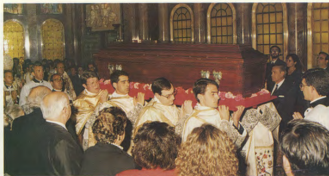
Procesión en la Iglesia Prelaticia de Santa María de la Paz, donde reposan los restos del Beato Josemaría Escrivá, el 21 de mayo de 1992.

tificio sobre la heroicidad de sus virtudes la define como «un verdadero fenómeno de piedad popular» que se hizo especialmente evidente con ocasión de la Beatificación: personas de todas las edades, de los países y condiciones sociales más diversos, se agolpaban, con orden y silenciosamente, para agradecer los favores obtenidos por su intercesión, y para pedir su ayuda en las necesidades espirituales y materiales que