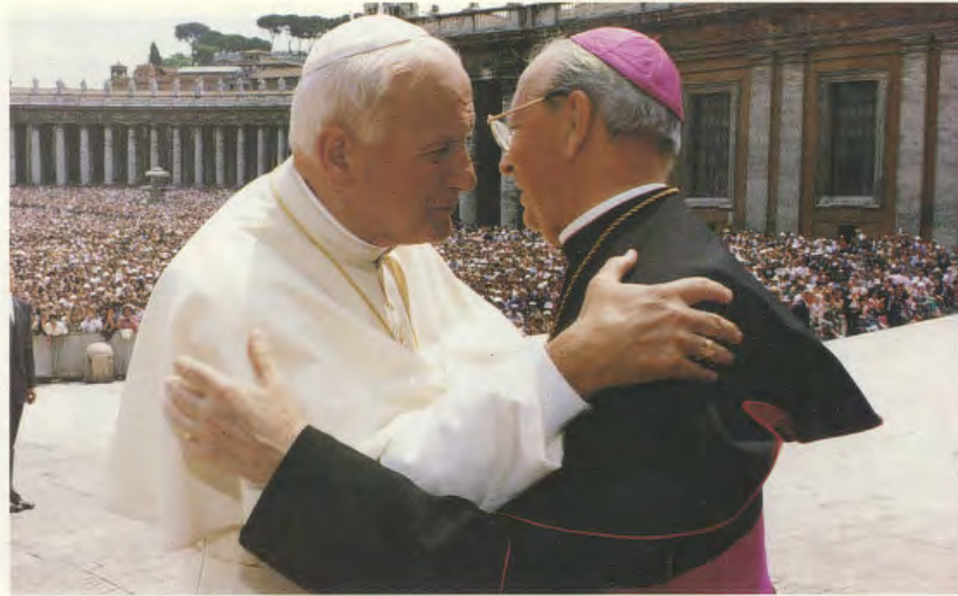
El Santo Padre abraza a S.E.R. Alvaro del Portillo, antes de comenzar la audiencia de 18 de mayo de 1992.

único deseo del Opus Dei y de cada uno de sus hijos es servir a la Iglesia como la Iglesia quiere ser servida 1 .