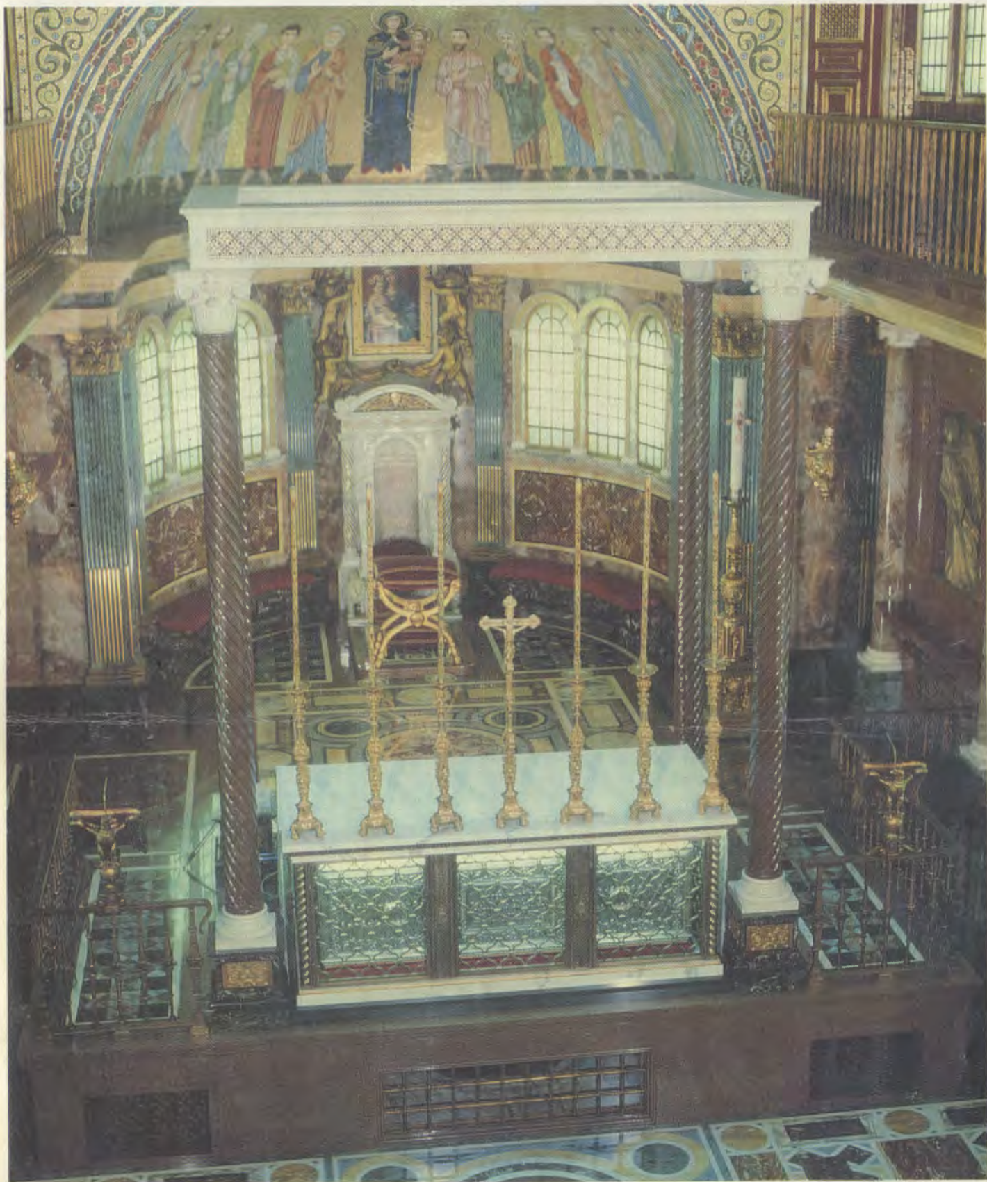
Altar de la Iglesia Prelaticia de Santa María de la Paz, con la urna que contiene el sagrado cuerpo del Beato Josemaría Escrivá de Balaguer