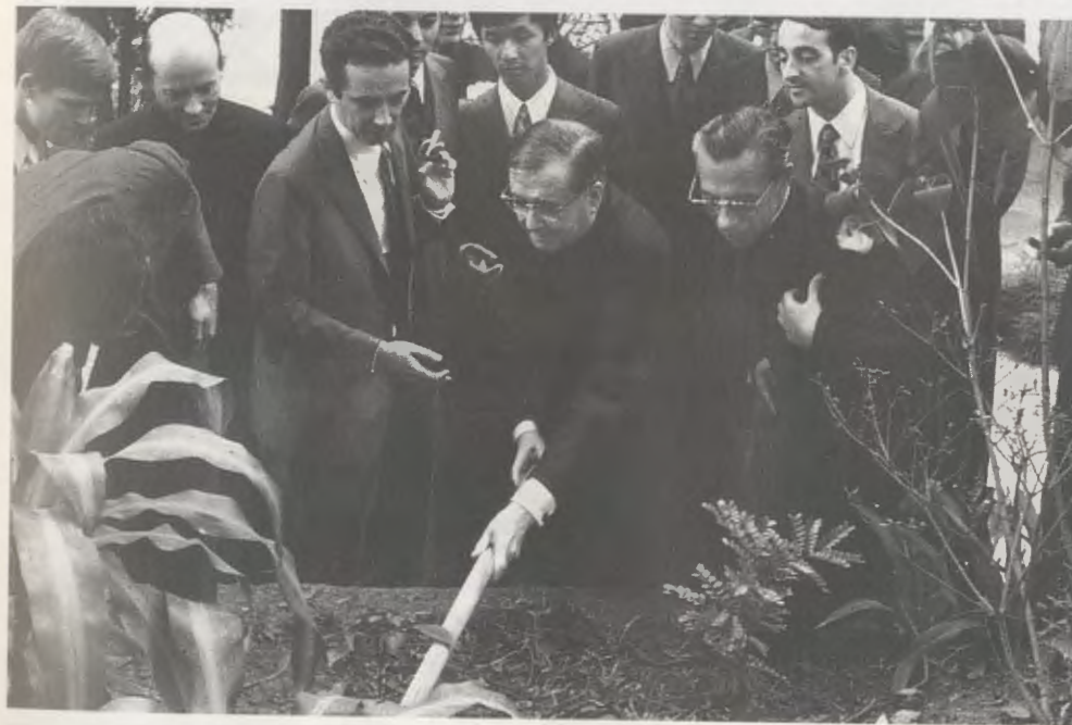
1974, Brasil, Sitio de Aroeira.

«Todos los que tuvieron el privilegio de conocerle pueden atestiguar que, cuando falleció en 1975, a los 73 años, era todavía muy joven. No había envejecido con el paso del tiempo. Al revés, su espíritu se hizo, año tras año, cada vez más joven, con una increíble vitalidad de juventud y de alegría. Todo esto, no nació sin esfuerzo, sino precisamente como fruto de toda una vida de lucha heroica que le llevó a unirse cada día más con el Señor» ( Opus Dei in Africa: a force for good , en «Sunday Nation», Nairobi 3-II-1980).