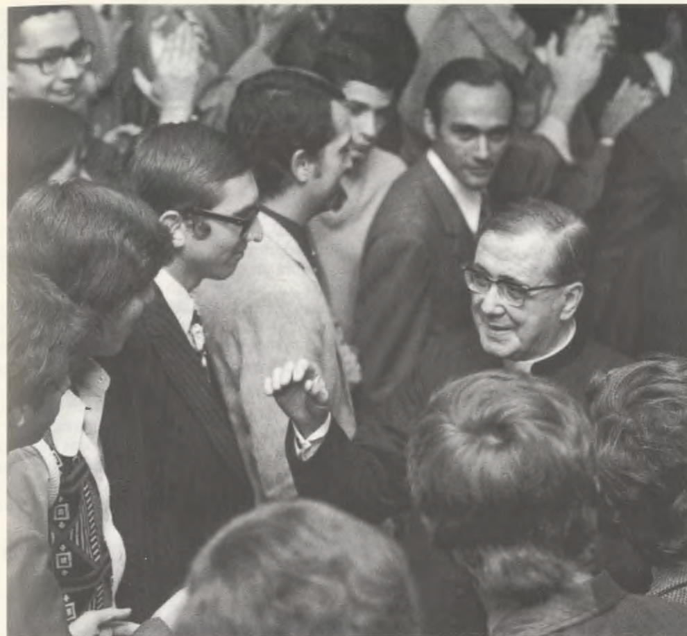
1974, São Paulo (Brasil).

«He tenido la posibilidad de hablar personalmente con él, con calma [...]. Su grandeza de carácter y su fe sobrenatural brillaban en la firmeza de sus convicciones y en una honda caridad con Dios y con los hombres [...].