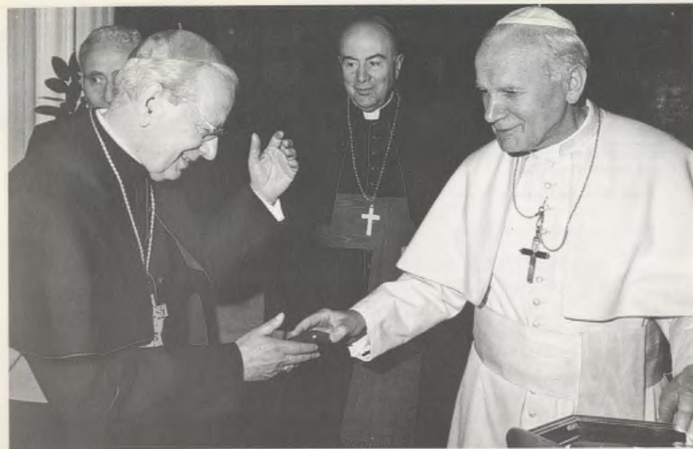
El Santo Padre, el Prefecto de la Congregación de los Santos, Cardenal Felici, y el Prelado del Opus Dei Mons. del Portillo el 9 de abril de 1990, después de la declaración de las virtudes heroicas del Venerable Josemaría Escrivá.

En 1946, Josemaría Escrivá fijó su domicilio en Roma: en 1947 y 1950, obtuvo la aprobación del Opus Dei como institución de derecho pontificio. Con una caridad infatigable y una activa esperanza, promovió y guió la expansión del Opus Dei por todo el mundo, contribuyendo a una vasta movilización de laicos, que fueran conscientes de su responsabilidad de participar en la misión de la Iglesia. Impulsó iniciativas de vanguardia en el ámbito de la evangelización y de la promoción humana; suscitó en todas partes vocaciones al sacerdocio y al estado religioso; emprendió viajes extenuantes por Europa y por América, para difundir la doctrina de la Iglesia. Y, sobre todo, se dedicó a la formación de los miembros del Opus Dei — sacerdotes y