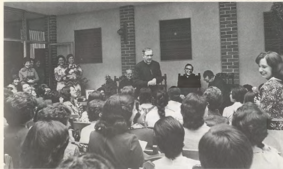
Guatemala, 1975, en un Centro para la formación de la mujer.

«El Dr. Escrivá es un sacerdote modelo, escogido por Dios para santificación de muchas almas, humilde, prudente, abnegado, dócil en extremo a su Prelado, de