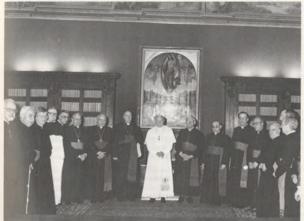
9 de abril de 1990. Después de la lectura del Decreto de virtudes heroicas del Venerable Josemaría Escrivá.

Regnare Christum volumus! , ésta ha sido la gran aspiración del Siervo de Dios, que también puede describirse así: Poner a Cristo en la cumbre de todas las actividades humanas. El servicio eclesial de Josemaría Escrivá ha suscitado un impulso ascendente hacia Dios en hombres inmersos en las realidades temporales, de todos los ambientes y profesiones, de acuerdo con aquellas palabras del Señor