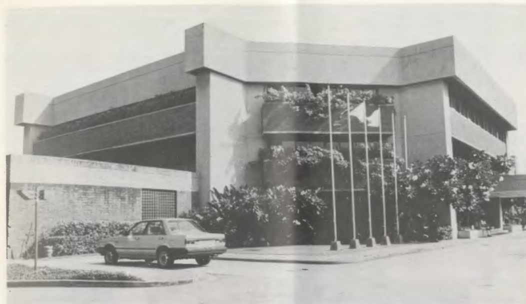
Una vista del CRC.