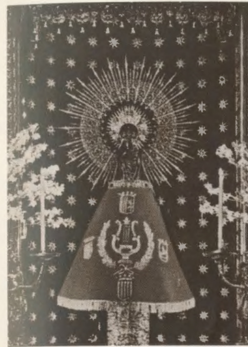
Imagen de Nuestra Señora del Pilar en la Santa Capilla de la Basílica del Pilar de Zaragoza, a donde acudía diariamente a rezar el Siervo de Dios.

seminario y en la universidad, han dejado testimonios explícitos de la piedad y virtudes humanas de Josemaría. «Era muy piadoso, con una piedad que me llamó poderosamente la atención. No era una piedad que yo llamaría sensiblera, de alguna manera, tristonía. Era una piedad simpática, alegre, atrayente, que no sólo era compatible, sino que sería raíz de su constante sentido del humor y de una visión positiva de la vida» (2). Un seminarista, que llegó a ser párroco en la diócesis de Tarazona, observaba que Josemaría, «durante la meditación, estaba en una actitud de oración intensa: para él debía ser realmente una conversación amorosa con Dios» (3).