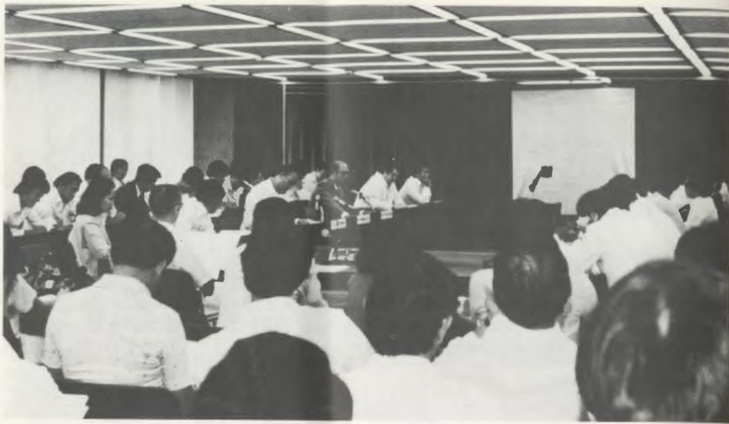
Aspecto de una conferencia para empresarios y ejecutivos en la sede del CRC.

nistración de Empresas, así como una especialización en Investigación Económica.