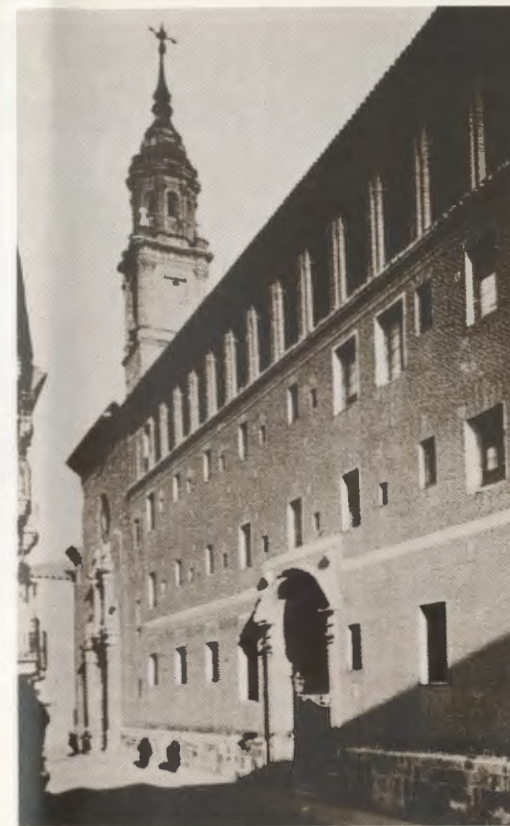
El Seminario de San Carlos.

Josemaría siguió pidiendo luz para un camino que, dentro del sacerdocio, aún no veía bien definido, esperando una respuesta del Señor. De momento sólo le empujaba una apasionada fidelidad a los designios divinos. Repetía, una y otra vez, con la fe del ciego de Jericó: Domine, ut videam!... ¡Señor, que vea!...; y también ut sit!... ¡que sea, que se cumpla eso que Tú quieres!... Estas palabras se hicieron jaculatoria en su alma y ya no las abandonaría en su diálogo con Dios, durante el resto de su vida. De aquellos años se conserva una inscripción, realizada por el Siervo de Dios en la base de una imagen de Nuestra Señora del Pilar, con esta misma jaculato-