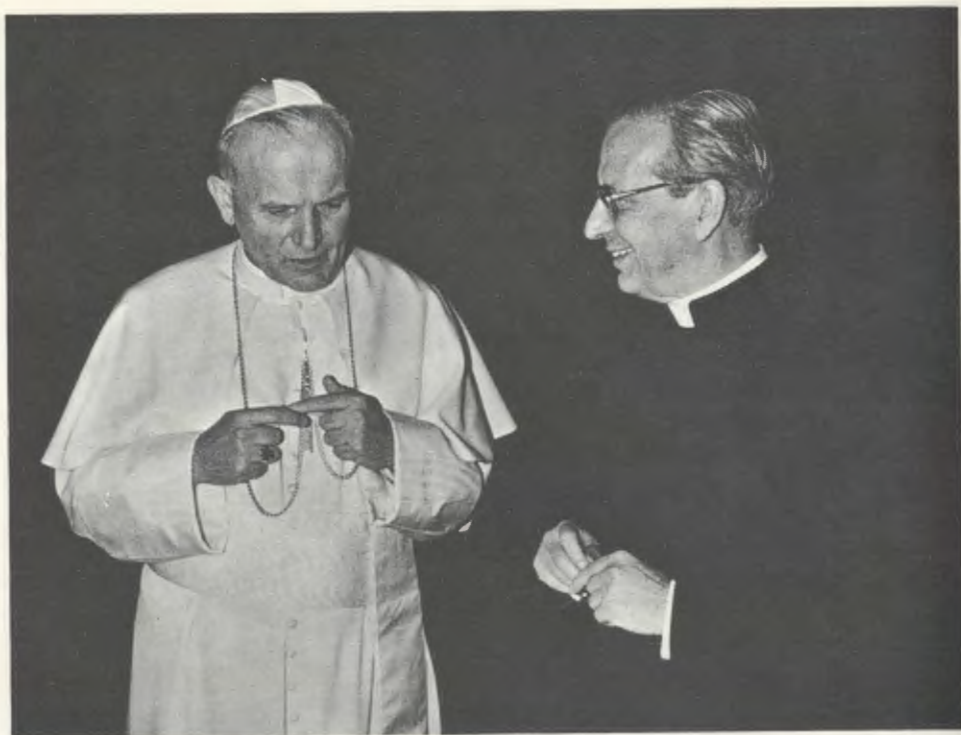
El 5 de febrero de 1981, Su Santidad el Papa Juan Pablo II ratificó el Nihil obstat de la Sagrada Congregación para las Causas de los Santos, a la introducción de la Causa de Beatificación y Canonización del Siervo de Dios Josemaría Escrivá de Balaguer.

Romano Pontífice y la lealtad a la Jerarquía son inconfundibles características suyas.