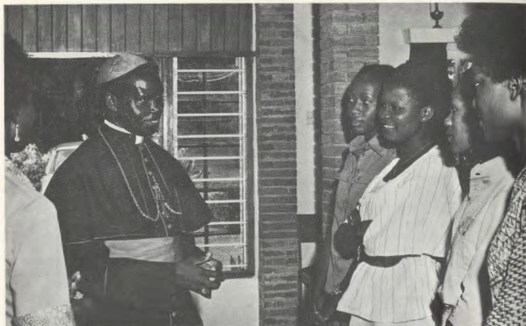
El Cardenal Maurice Otunga, Arzobispo de Nairobi, en Kianda College.

había ya alumnas de los tres países del África Oriental, y a partir de 1967, de muchos otros del Continente africano: Nigeria, Etiopía, Zambia, Ghana, Lesotho... En ese mismo año, se abrió una Residencia para cien chicas, y en un ala del nuevo edificio comenzó Kibondeni School, una Escuela hotelera. En 1973, también bajo el impulso directo de Mons. Escrivá de Balaguer, que no llegó a verlo hecho realidad, se pusieron las bases de Kianda High School, un colegio de enseñanza media que actualmente tiene 350 alumnas. Desde el principio, esta iniciativa contó con el apoyo entusiasta de las tres mil antiguas alumnas de Kianda, deseosas de que sus hijas se educaran en el mismo ambiente que habían conocido ellas.