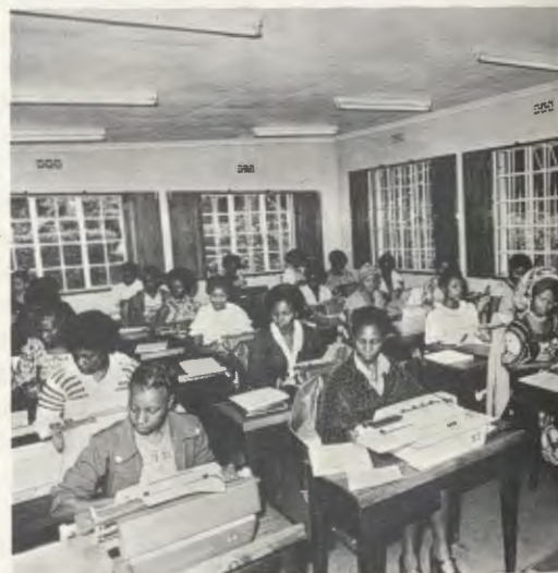
Clase de mecanografía en Kianda College.

Así respondía Mons. Escrivá de Balaguer, en 1966, a las preguntas de un periodista. Y el desarrollo de la Obra en países de los cinco continentes es la mejor demostración de la exactitud de esas palabras.