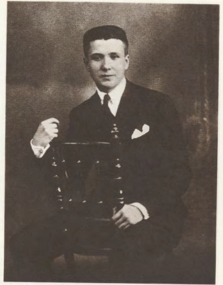
Josemaría a los 19 años.

En 1946 el Siervo de Dios se trasladó a Roma, donde fijó definitivamente su residencia. En 1947 obtuvo de la Santa Sede el decretum laudis para el Opus Dei que, el 16 de junio de 1950, recibió la aprobación definitiva como institución de derecho pontificio. Simultáneamente fue aprobada la Asociación de Cooperadores del Opus Dei, en la que podían ser admitidos también los acatólicos.