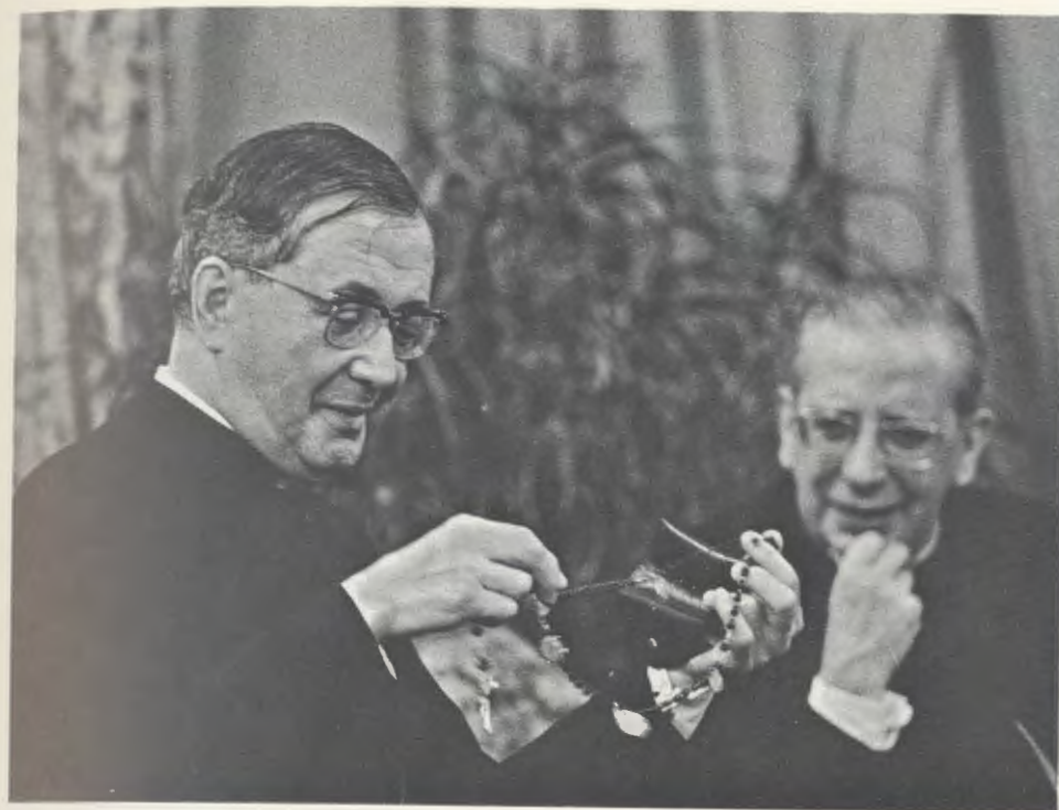
Con don Álvaro del Portillo, en Lima (Perú), el 25 de julio de 1974.

En la base de la espiritualidad del Siervo de Dios se halla una profunda percepción del misterio de Jesús, perfecto Dios y perfecto hombre, que se manifiesta en el entrelazamiento de lo divino y lo humano, en unidad de vida . En su vida personal demostró esta íntima fusión de contemplación y acción, de vida interior y actividad cotidiana. Las virtudes sobrenaturales se unían con las virtudes humanas, haciendo de él el ejemplo de una santidad entretejida de sencillez y naturalidad, construida de fidelidad en las cosas pequeñas. Vivía profundamente el sentido de la filiación divina, que se traducía en un confiado abandono en Dios Padre, en la primacía de la