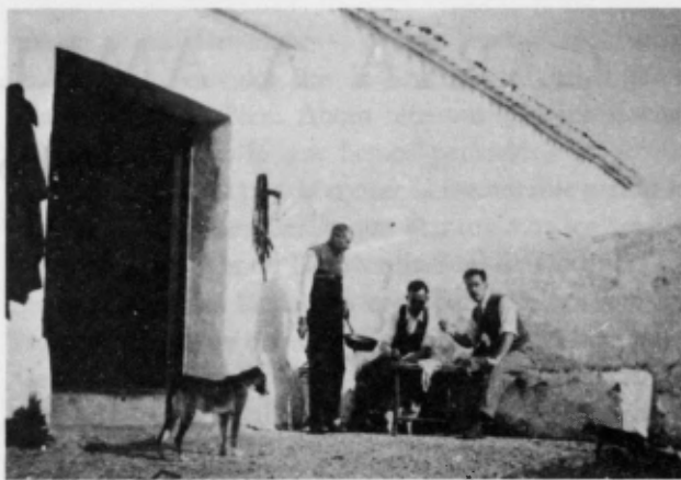
Monte Acosta. 4 enero 1948.

A los pocos días, el farmacéutico de Aracena recibía la visita de unos «turistas» extremeños, que le felicitaban por la preparación de los chicos. Él contestó sin jactancia: «Ese muchacho prestigia a todos sus profesores.»