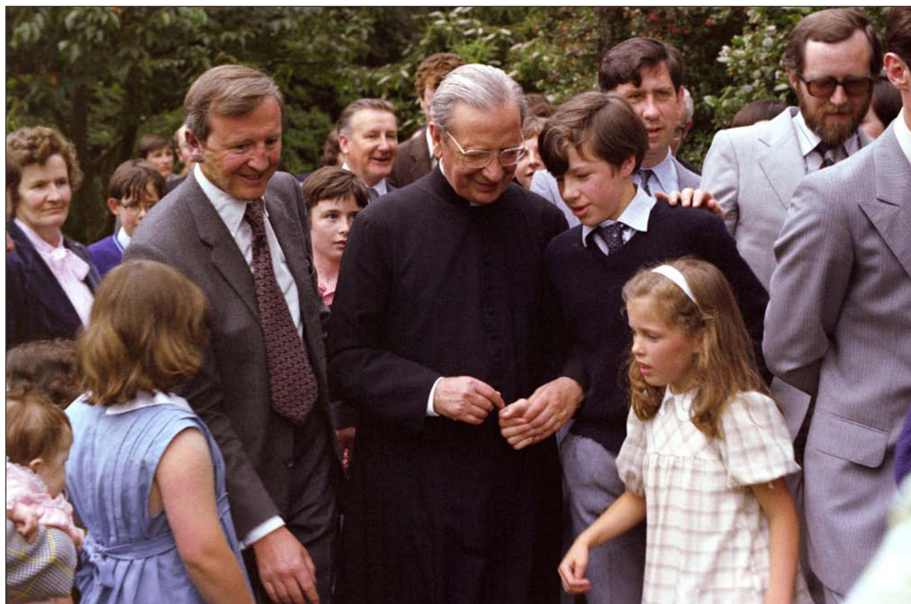
El Señor dispuso despertar entre los fieles laicos la llamada a la santidad, que no consiste en no tener defectos, sino en luchar para ser leales al Señor, en aprender a amar a Dios y a los demás superando día a día nuestro egoísmo

La constante preocupación de san Josemaría por la santidad de los sacerdotes fue igualmente uno de los grandes motores que impulsaron la acción pastoral de don Álvaro, que se tradujo en llevar muy en su corazón a los demás sacerdotes diocesanos cuando sucedió al fundador. El último año de su vida, tuvo la alegría de poder afirmar que «san Josemaría soñaba con la magnífica realidad que hoy contemplamos: que un gran número de sacerdotes,