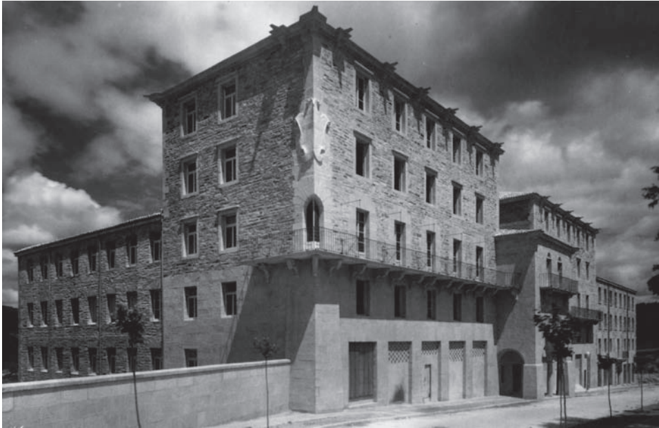
El colegio mayor La Estila en los años cincuenta.