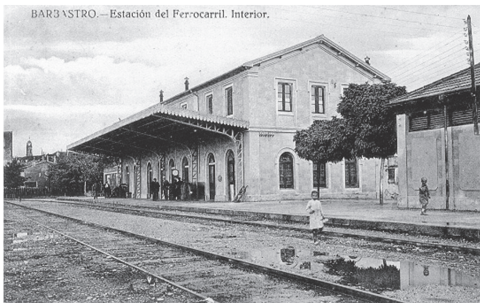
Estación de tren Barbastro, hoy desaparecida.