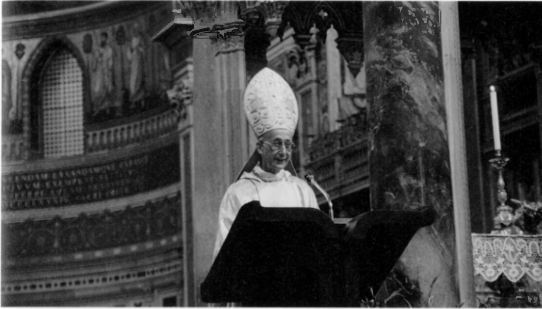
En la tarde del 19 el Cardenal Camillo Ruini celebró en la basílica de San Juan de Letrán.

¿Qué podía yo hacer? Lo que hice. Agaché la cabeza y me puse en una pequeña cola que se había formado para saludar al Padre. El Padre es lo más parecido que he visto a un santo en vida. Las pocas veces que he estado cerca de él se me ha puesto un nudo en la garganta. Y en esta ocasión se me saltaron las lágrimas porque me dio dos besos, al tiempo que me animaba a seguir escribiendo las tonterías que escribo; y para colmo a mi mujer le felicitó por ser mi asesor literario. Es decir, derrochó con nosotros la benevolencia propia de un padre que es todo corazón.