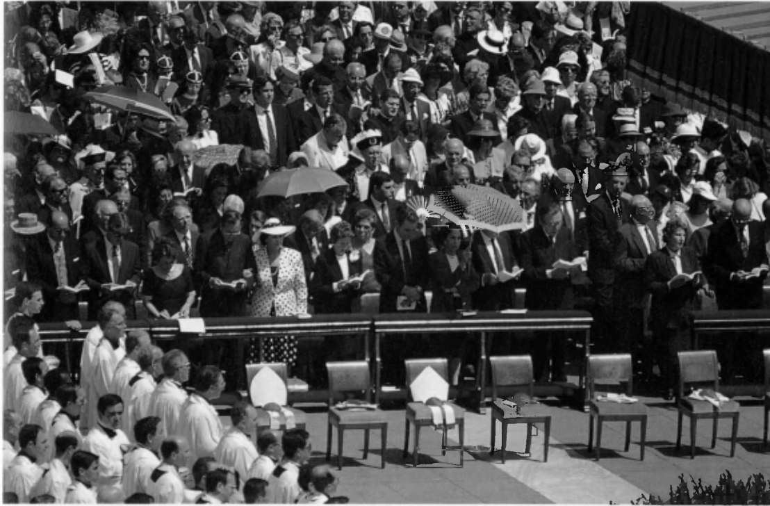
Tribuna de autoridades. En la primera fila se distingue a Giulio Andreotti.

zar mejor que yo. E incluso que mi asesor literario que, lo reconozco, es más piadosa que yo.