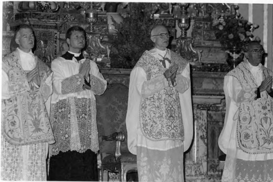
El 20 de mayo, el Cardenal Augustin Mayer en la misa de San Andrea della Valle.