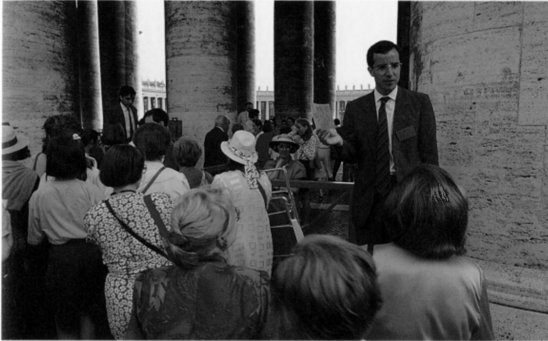
La plaza de San Pedro estaba dividida en nueve zonas con diferentes accesos.

Al día siguiente, 18 de mayo, redoblaron los aplausos de la esperanza porque después de la misa concelebrada, en honor del nuevo Beato, tuvimos la oportunidad de felicitar al Santo Padre que en tal fecha cumplía 72 años. Nos recibió en audiencia en la misma plaza de San Pedro, que ofrecía un aspecto muy parecido al del día anterior. Cuando apareció en su coche descubierto y discurrió entre nosotros, se dio cuenta de que le queremos de verdad. Le aplaudimos hasta la extenuación y le cantamos el “Cumpleaños feliz” en diversos idiomas. Nos abrió los brazos y todos nos sentimos abrazados entre ellos. Sabe que le queremos porque hemos aprendido de nuestro fundador a amar al Papa, sea quien sea, y a servir a la Iglesia como quiere ser servida. Pero en tan feliz ocasión se lo manifestamos de todo corazón, porque a Juan Pablo II es muy fácil quererle.