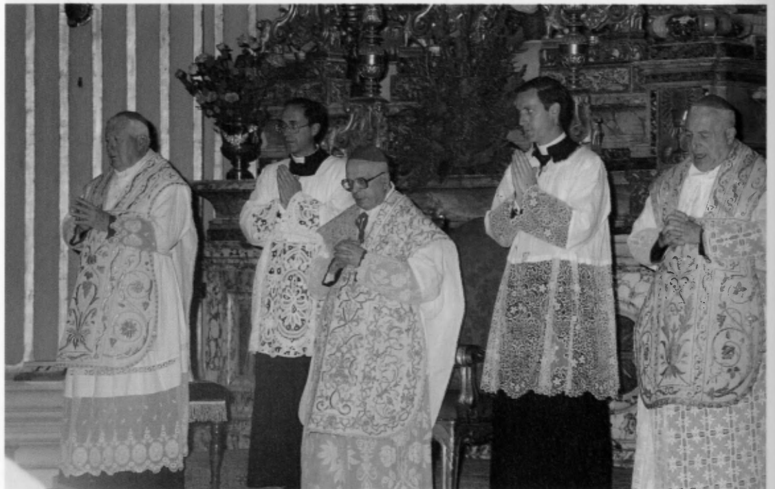
En la tarde del día 19 el Cardenal Palazzini celebró en la iglesia de San Andrea della Valle.

Confío que plumas más doctas que la mía explicarán en las páginas de este libro las excelencias artísticas de San Eugenio; yo sólo me detendré en las excelencias humanas de gentes llegadas de los cinco continentes para dar gracias al Beato Josemaría. ¡Qué manera de rezar con el cuerpo y con el alma! En el silencio sobrecogedor de gente que sabe estar dentro de una iglesia, cada uno agradecía, impetraba, y yo tuve la sensación de que estaba participando de la oración de todos ellos, saliendo ganancioso, porque cualquiera, a juzgar por el fulgor de sus miradas y la medida de sus más mínimos movimientos, sabía re-