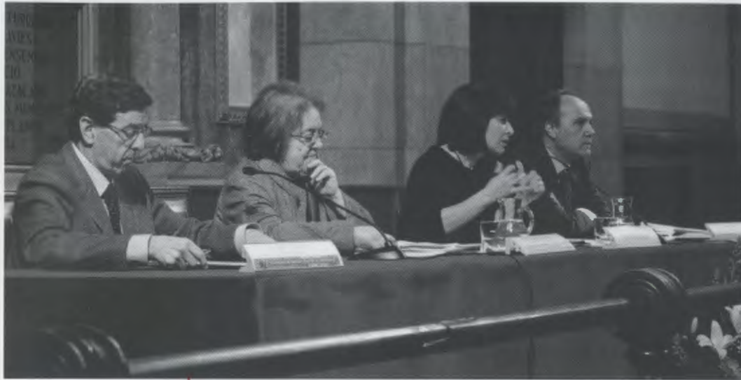
Taula rodona amb representants de Braval, Càritas i Comunitat de sant Egidio.