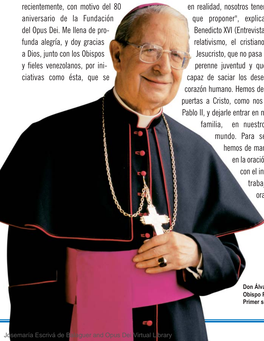
Don Álvaro del Portillo, Obispo Prelado del Opus Dei. Primer sucesor de San Josemaría

Todo esto refleja una realidad en la vida de muchos cristianos, que luchan cada día por acabar bien su trabajo, que procuran ofrecer a Dios todo lo que realizan, los éxitos y los fracasos, lo que resulta fácil y lo que cuesta más. ¡Cuántas personas, en Venezuela y en todas partes, se levantan temprano para atender a su familia, o para dirigirse a su lugar de trabajo, y se encomiendan a Dios desde el primer momento, van conversando con Él al salir de la casa, lo invocan para que les dé paciencia ante las inclemencias o las calamidades, piden la bendición de Dios para sus padres o para los sacerdotes, y para sus hermanos los otros hombres, se afanan por terminar bien sus tareas...! Todo esto, que puede sonar tan normal y corriente, se nos abre también como camino de santidad.