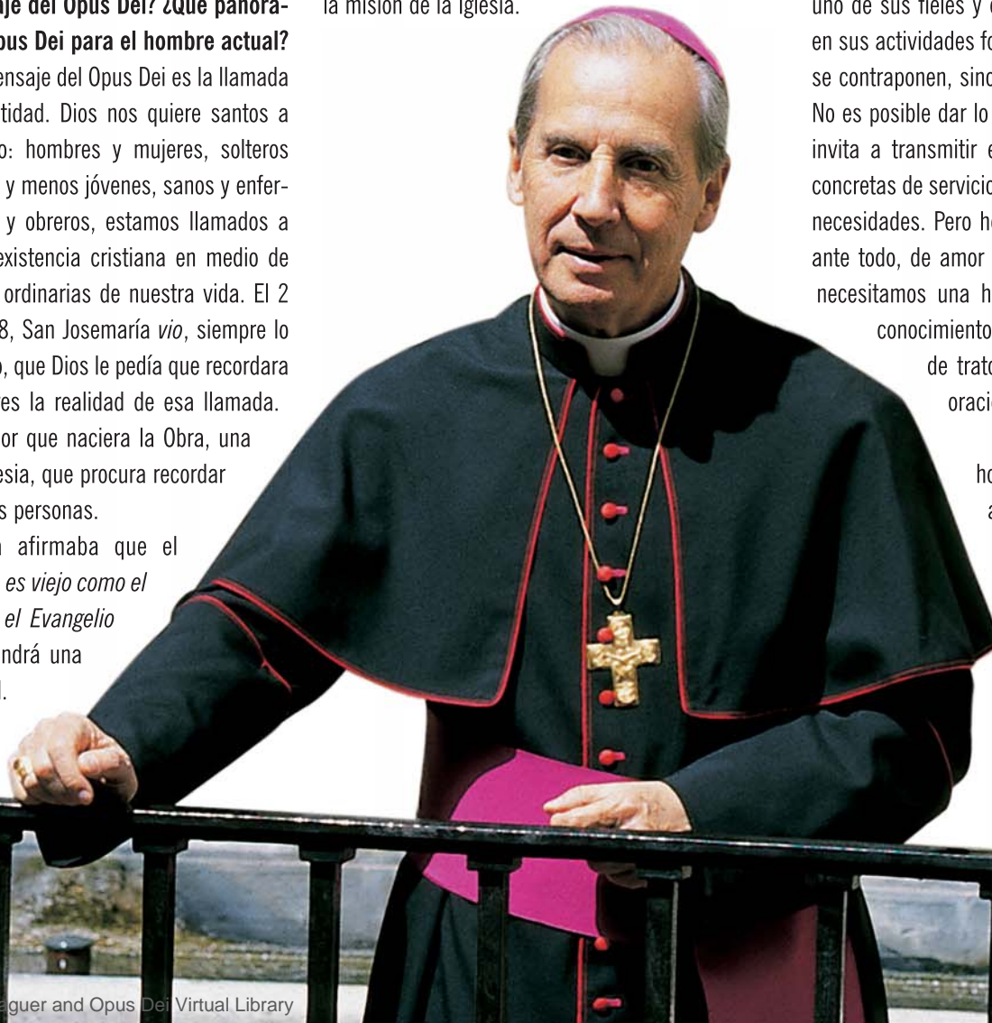
Mons. Javier Echevarría

El Opus Dei ayuda a mujeres y hombres a conducirse conforme a su fe cristiana en la actividad diaria; y les ofrece la atención espiritual y la formación oportunas. A partir de ahí, el apostolado principal del Opus Dei se traduce en el que