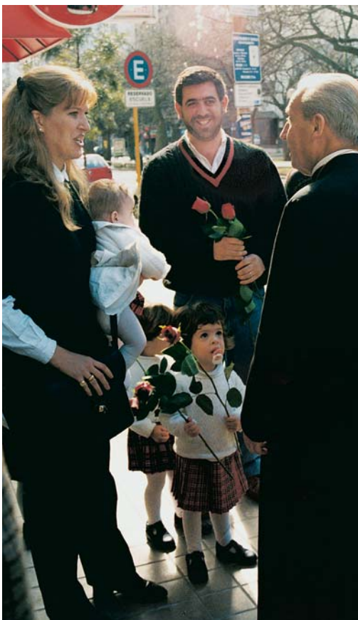
Mons. Javier Echevarría comparte con un grupo familiar

Como afirmaba también ese santo sacerdote, lo que se necesita para conseguir la felicidad, no es una vida cómoda, sino un corazón enamorado (Surco, n. 795) . Y el amor se prueba en el sacrificio, en la capacidad de olvidarse de uno mismo para entregarse al prójimo. El hombre y la mujer, creados el uno para el otro, han de descubrir su vocación al amor y comprender que, si desean cumplir bien su altísima tarea, deben prepararse y rezar mucho. La felicidad matrimonial se construye cada día, con detalles de servicio y de cariño, aprendiendo a perdonar y a pedir perdón, a comprender, a amar.