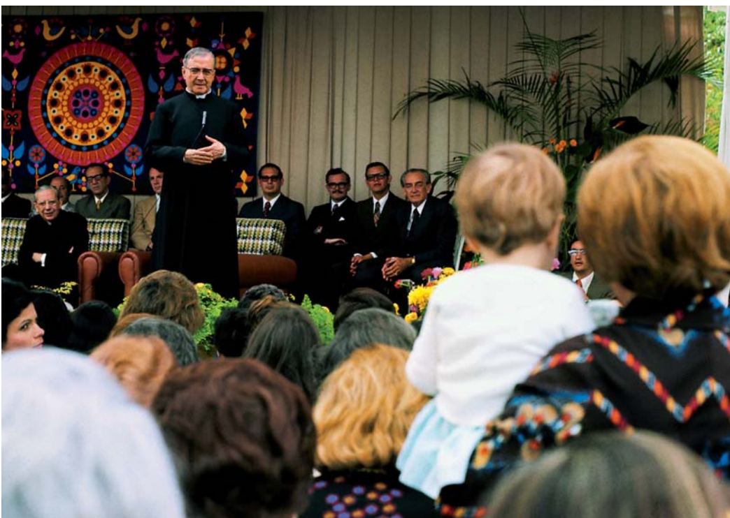
San Josemaría en Alto Claro, Venezuela

Jesucristo ha vencido a la muerte, al pecado y al demonio. Él nos acompaña en la Eucaristía; nos busca y nos escucha en todo momento. Él nos ha enviado, junto con el Padre, al Espíritu Santo, para renovar nuestros corazones y comunicarnos su propia vida divina. ¿No tenemos acaso profundos motivos para llenarnos de esperanza?