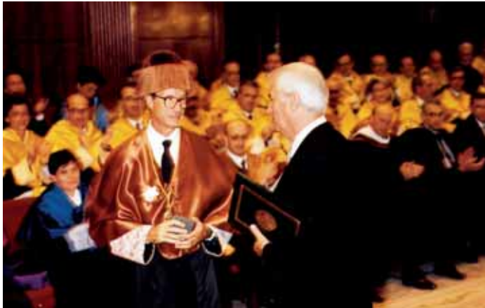
Durante la entrega de la medalla de oro de la UN.

"(...) Fue profesor mío en dos ocasiones. En Mecánica de Fluidos y la Tecnología Automática. Era un hombre entrañable. Recuerdo que un día, cuando él ya no daba clases y no estaba por la Escuela (creo que estaba viviendo en Pamplona), me lo encontré en el autobús y al saludarlo me trató con un cariño que nunca podré olvidar. Sin duda era un hombre bueno. (...)".