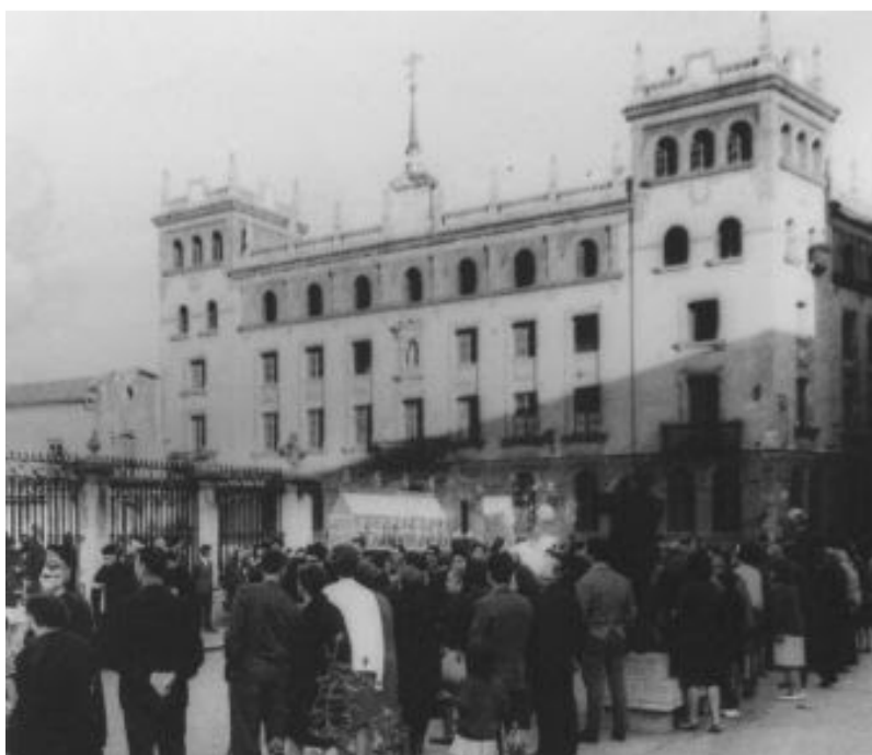
Procesión ante el Palacio Episcopal de León hacia los años 40.