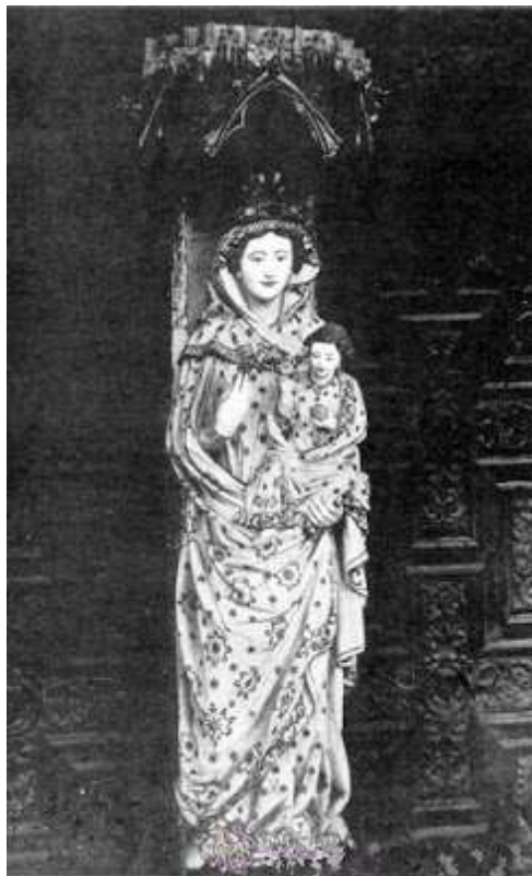
Imagen de la Virgen Blanca en el parteluz de la portada oeste de la Catedral de León.