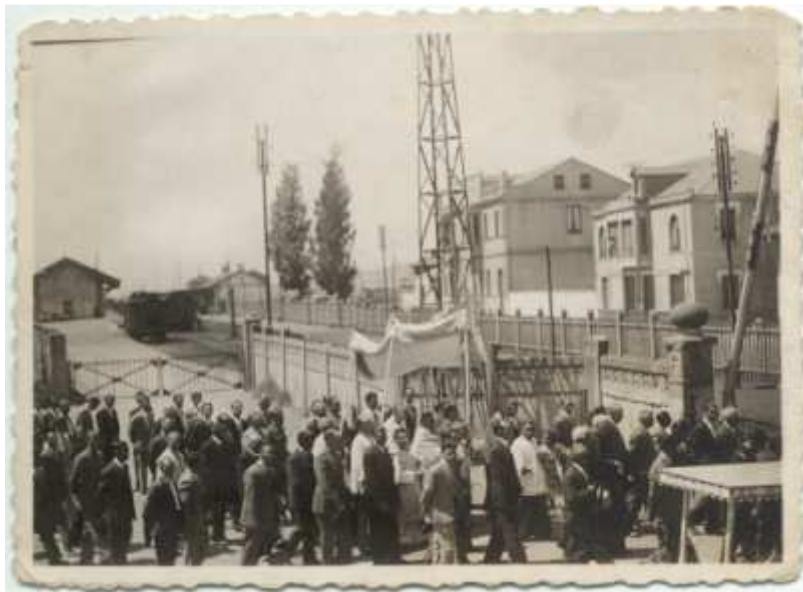
Estación de Veguellina de Órbigo hacia 1940.