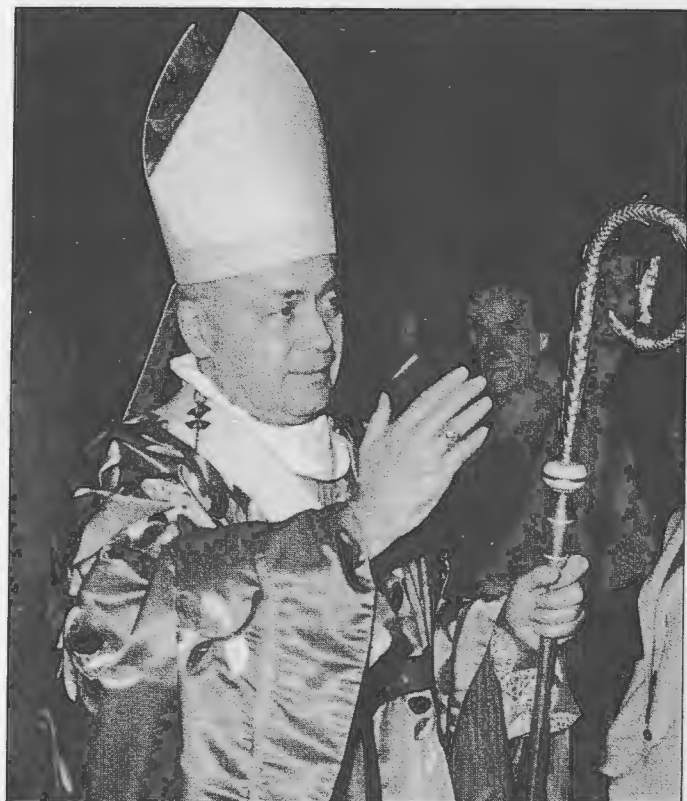
B enelli a Firenze. Disse ad un incontro con alcuni seminaristi fiorentini: «I maggiori nemici sono uomini che si sono accomodati nella Chiesa e si opporranno alla novità del Vangelo»

Questa è l'unica via da percorrere». Notevole fu anche il suo impegno in favore della vita: Benelli fece arrivare a Firenze le suore di Madre Teresa di Calcutta, aprì centri di accoglienza per i tossicodipendenti e quattro case per le ragazze-madri. Ma al di là delle battaglie referendarie e della sua programmatica avversione ai totalitarismi e alle ideologie che negavano la libertà e soprattutto minacciavano quella della Chiesa, l'ultimo periodo fiorentino di Benelli è caratterizzato da una nuova, tremenda consapevolezza. L'8 ottobre del 1982, parlando ai seminaristi della diocesi di Firenze, il cardinale disse: «Non bastano i bei discorsi per evangelizzare, non bastano le tecniche pastorali, non bastano gli schemi metodologici per arrivare in maniera più comprensibile alla gente d'oggi». E poco più oltre: «Abbiamo ascoltato un brano del Vangelo che ci racconta uno dei momenti più acuti del contrasto fra Gesù e la gente alla quale egli era stato mandato. Chi sono coloro che si oppongono? Pensiamoci bene, quali sono i più grandi oppositori di Gesù? Sono gli uomini di religione, sono coloro che maggiormente osservano la parola di Dio... La religione è il