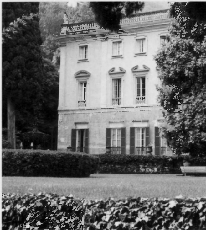
Qui a destra e nella pagina accanto: due scorci del giardino ad Urìo

La libertà di insegnamento, infatti, non è se non un aspetto della libertà in generale, e l'accesso all'università deve essere libero per tutti coloro che ne hanno le