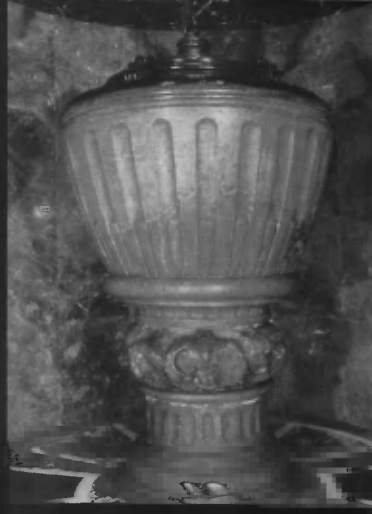
Chrzcielnica, gdzie był ochrzczony święty dom rodzinny w Balaguerze