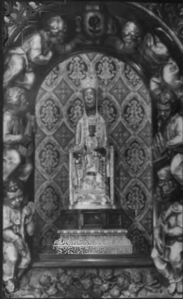
Cudowna figurka Maryi z Dzieciątkiem pochodzi z XI w.