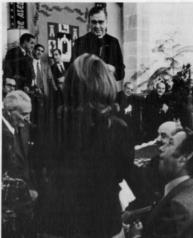
A Pozoalbero, œuvre collective de l'Opus Dei en Espagne, en 1972

Le Serviteur de Dieu rappelait que « la sainteté est personnelle et que le péché est personnel : par conséquent le remède doit être appliqué personnellement », au cours de la rencontre en tête à tête avec le Seigneur, qu'il faut préparer avec soin. Mgr Escrivá ne manquait pas de préciser chacun des actes qui constituent le sacrement de la pénitence : examen de conscience, douleur de nos fautes, résolution de ne plus pécher et d'éviter les occasions, confession auriculaire personnelle, pénitence sacramentelle. Et celui qui s'efforce de s'approcher de la confession avec les dispositions requises, assurait-il, parvient à une connaissance de plus en plus profonde et intime de la tendresse que Dieu apporte à suivre ses pas sur la terre. « Comme nous devons remercier Dieu notre Seigneur pour ce sacrement de sa miséricorde ! Moi, j'en suis émerveillé ; j'en suis ému.