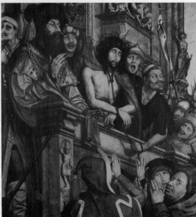
Jésus présenté au peuple, Quentin Metsys (Musée du Prado, Madrid)