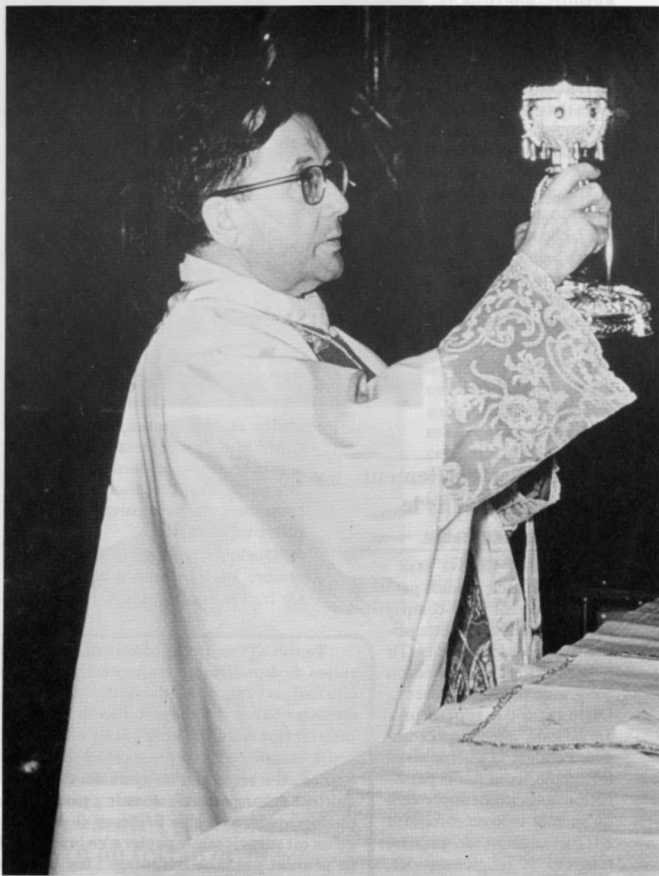
Le 31 décembre 1959 à Rome.

Au séminaire, il passait des heures en adoration devant le Saint-Sacrement. Lorsque, jeune prêtre, il se vit confier la paroisse du village de Perdiguera, en 1925, il y exposa quotidiennement le Saint-Sacrement.