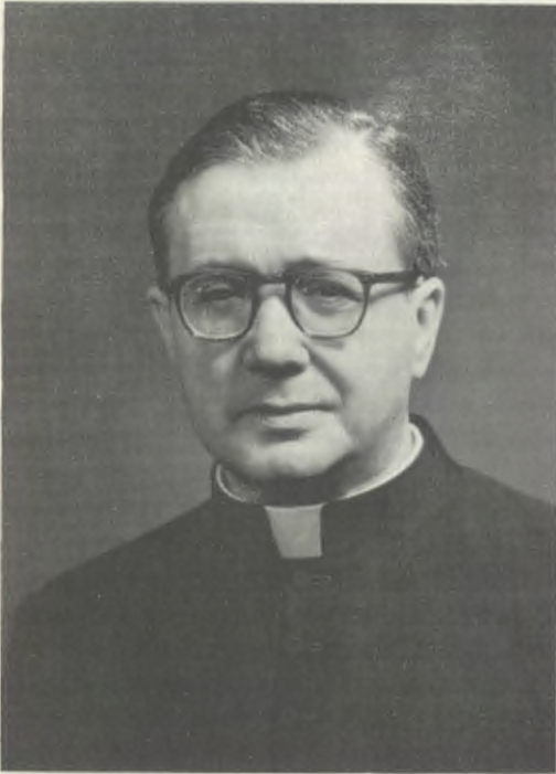
Monseñor José María Escrivá de Balaguer y Albás.

Comienzo hoy una tarea árdua, pero aleccionadora y estimulante, una auténtica aventura; el desfile de ex-alumnos brillantísimos de las Escuelas Pías.