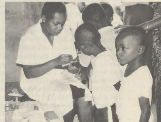
Christelijke liefde dient vertaald te worden in werken van dienstbaarheid.

In oktober 1997 opende Monkole ook een Hoger Instituut voor Verpleegkunde, waar ieder jaar ongeveer vijftig leerlingen zullen afstuderen. Wederom een initiatief dat zal bijdragen aan de oplossing van een duidelijke nood in het nationale gezondheidssysteem.