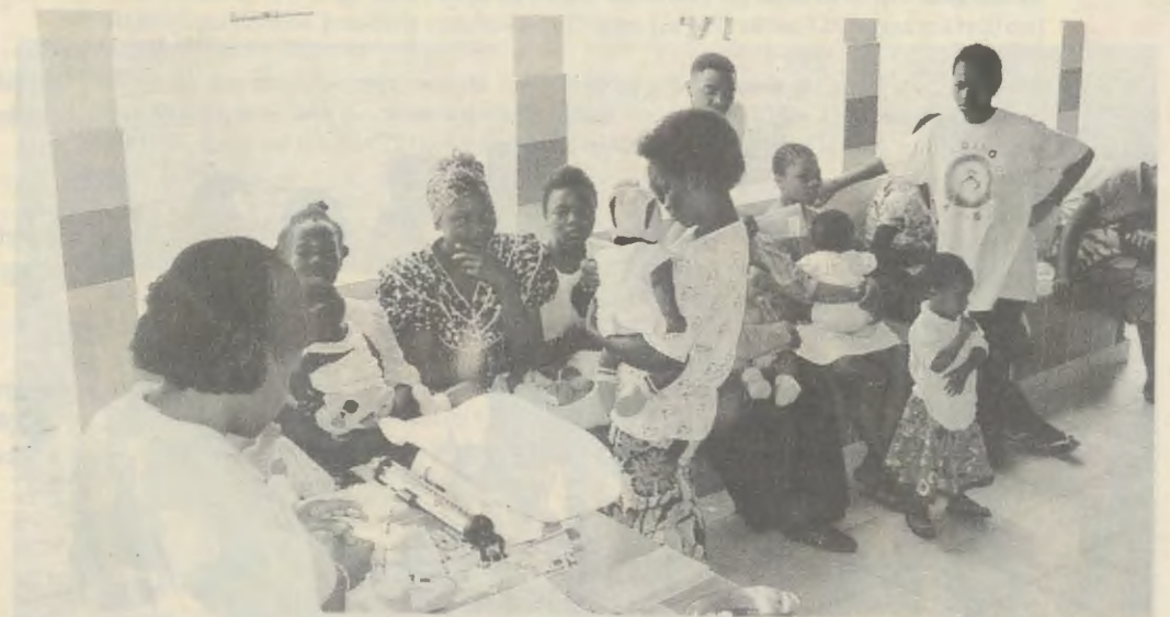
Monkole levert een bijdrage aan het verlichten van het gebrek aan gezondheidsvoorzieningen in een buitenwijk van Kinshasa: Mont Ngafula.

In de laatste jaren is Kinshasa uitgegroeid tot een stad met meer dan 5 miljoen inwoners. De massa-immigratie, vooral in de randgebieden van de stad, is op dramatische wijze de capaciteit van de infrastructuur van de hoofdstad te boven gegaan. In de voorsteden ontbreken er essentiële voorzieningen, in het bijzonder op het gebied van de gezondheidszorg. Om deze toestand te verlichten, hebben in 1987 enkele gelovigen van de Prelatuur van het Opus Dei het plan opgevat in Mont Ngafula, een van de buitenwijken van Kinshasa, een medische hulppost op te richten. In april 1991 werd Monkole in gebruik genomen. Het Medisch Centrum werd klein geboren, maar met immense vooruitzichten op arbeid: de medische noden, de opleiding in de gezondheidszorg en de eerste hulpverlening dekken in een wijk in uitbreiding, om zo tot basis te dienen voor een meer omvattend hulpplan. Vanaf het begin heeft Monkole zijn activiteiten vooral gericht op de meest behoeftige bevolking. De geschiedenis van het Medisch Centrum wordt gekenmerkt door het onderrecht van de zalige Josemaría, die toonde dat christelijke liefde vertaald dient te worden in werken van dienstbaarheid. Het voorwerp van zijn voorkeur waren in het bijzonder de zieken, armen en kinderen, zoals hij in herinnering bracht bij de