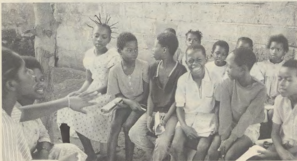
De doelstellingen van Eliba dragen tegelijkertijd een medisch en een sociaal karakter.

Om meer patiënten te kunnen opvangen is het Medisch Centrum Monkole in 1995 uitgebreid met de Eliba-"antenne", in een andere buitenwijk van Kinshasa, Kindele. De doelstellingen zijn medisch en sociaal van aard: de ernstige gezondheidsnoden van de bevolking verlichten en zich inzetten voor de bevordering van het menselijk welzijn van degenen die de polikliniek bezoeken. Daartoe worden de bewoners van de wijk verzorgd door een team van verpleegsters en ontvangen zij wekelijks bezoek van een arts uit Monkole. In de "antenne" worden ook cursussen gegeven over hygiëne, alfabetisering en over andere meer huishoudelijke taken. Eind 1996 is er nog een soortgelijke "antenne" geopend in Kimbondo, een plattelandswijk eveneens zonder medische voorzieningen. Enkele studenten geneeskunde verrichten eerst, onder leiding van personeel van Monkole, een promotie-campagne bij de bewoners van het gebied. Gelijktijdig worden in Monkole programma's ter voorkoming van ziektes onder schoolgaande kinderen uitgevoerd. Het gezondheidspersoneel van het Centrum bezoekt een twintigtal schoolcomplexen; daarmee worden ongeveer 13.000 leerlingen bereikt en krijgen circa 500 leerkrachten lessen in gezondheidszorg.