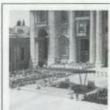
De zalige JOSEMARÍA ESCRIVÁ Stichter van het Opus Dei