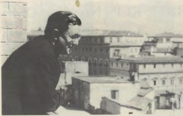
Op het terras van het appartement aan de Piazza della Città Leonina.