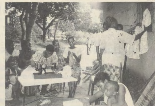
In Eliba, een uitbreiding van Monkole in een andere wijk aan het uiteinde van Kinshasa, Kindele.

Gedurende de jongste oorlog in de Republiek Congo was het Medisch Centrum betrokken bij de coördinatie voor eerste hulpverlening aan de slachtoffers van het conflict.