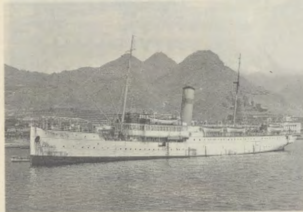
Het motorschip J.J. Sister op een foto uit 1974.