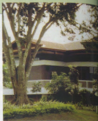
Dualtech startte in 1982. Sindsdien hebben er 20.000 gespecialiseerde arbeiders hun diploma behaald.

Wij vragen altijd een minimale bijdrage: we vinden