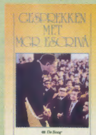
Gesprekken met mgr. Escrivá