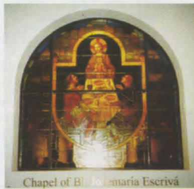
Chapel of Bl. Josemaría Escrivá

De kapel van het Catholic Information Center in Washington, toegewijd aan de zalige Josemaría.