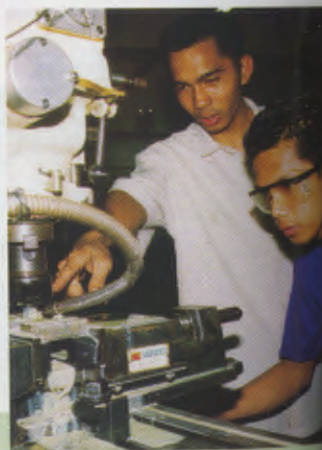
Dualtech biedt cursussen elektromechanica en precisietechniek aan.