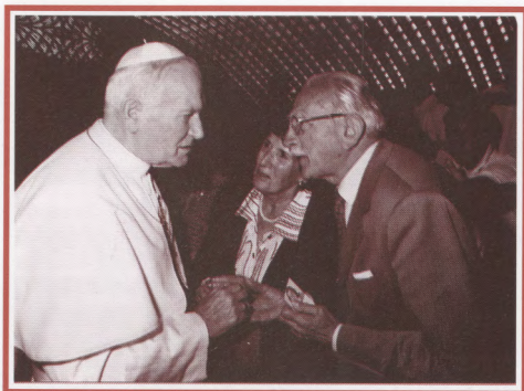
Paus Johannes Paulus II met de ouders van de Dienares van God.