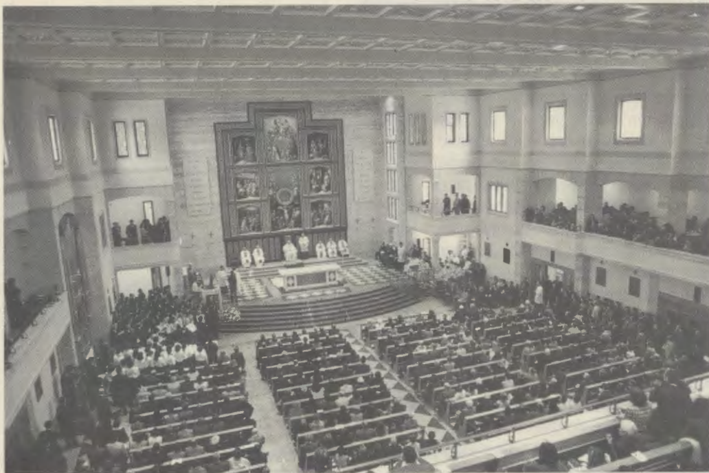
Tijdens de liturgische plechtigheid.

Om deze reden hebben de gelovigen en medewerkers van de prelatur zich met hart en ziel verenigd met het idee van mgr. Álvaro del Portillo, die de Heer nu twee jaar geleden tot zich heeft geroepen, om Uwe Heiligheid een kerk in Rome aan te bieden. Dit met de vreugde om, met hun giften — kleine of grote, maar altijd de vrucht van een persoonlijk offer — te kunnen bijdragen aan deze dienst voor het bisdom van de Paus.