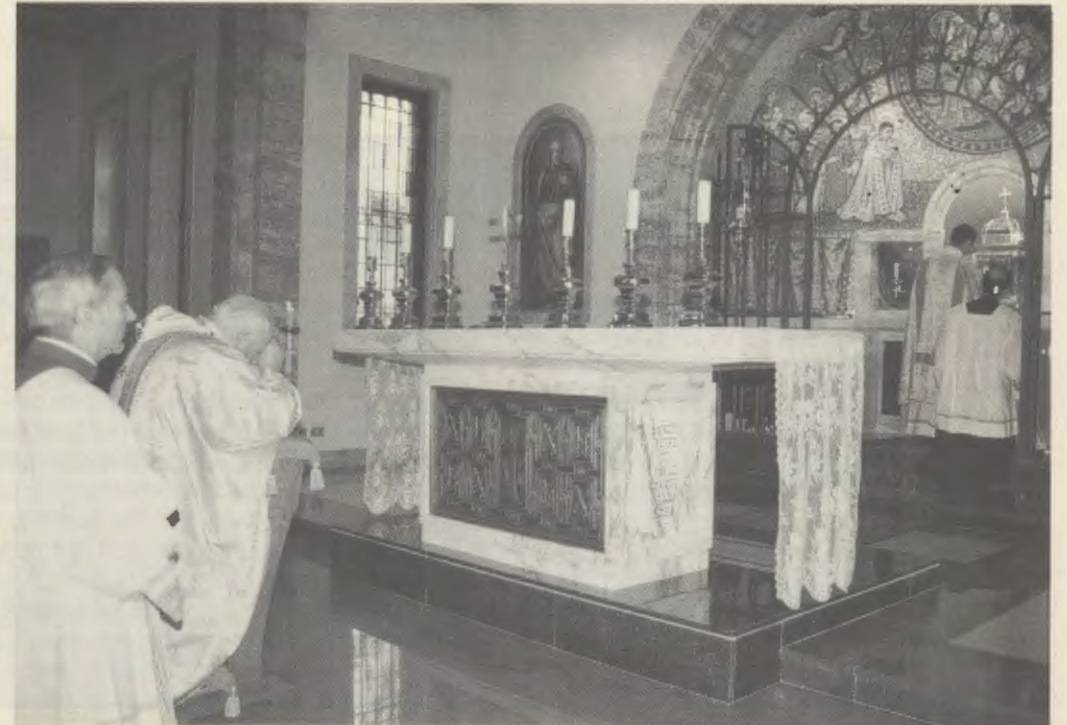
De heilige Vader bidt bij het Allerheiligste Sacrament, dat voor de eerste keer in de kapel bewaard bleef op de wijdingsdag van de kerk.

We hebben geprobeerd dat deze kerk de boodschap die de Heer de zalige Josemaría heeft toevertrouwd weerspiegelt: het zoeken naar de heiligheid door middel van het gewoon werk, menselijke zo volmaakt mogelijk, uit liefde tot God, in dienst van mannen en vrouwen van iedere stand en sociale conditie. Zoals Uwe Heiligheid op 17 mei 1992, in de homilie van de plechtige ritus van de zaligverklaring van de stichter van het Opus Dei, hebt herinnerd, is het werk ook een middel tot persoonlijke heiliging en apostolaat, wanneer men verenigd met Jezus Christus leeft, want de Zoon van God heeft zich, bij de Vleeswording, in zekere zin verenigd met heel de realiteit van de mens en met heel de schepping.