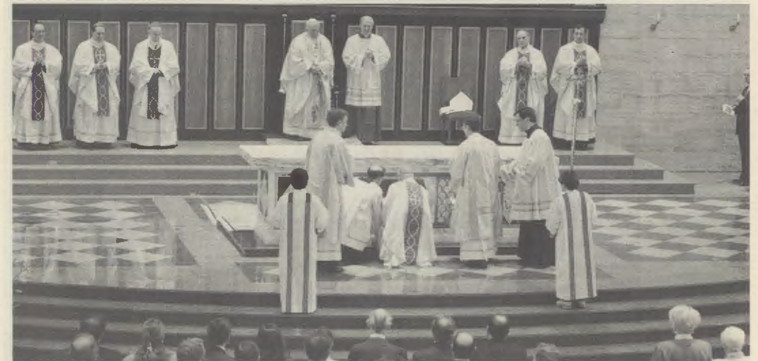
De prelaat van het Opus Dei plaatst relikwieën van de zalige Josemaría binnen in het altaar!

De plechtige erkenning van zijn christelijke voorbeeldigheid, die de opvolger van Petrus en met hem de hele Kerk heeft verkondigd, klinkt als een oproep om eens te meer de laatste en diepste zin van de deugd van nederigheid te overwegen: een veilige weg om bij God te komen. Mezelf verbergen en verdwijnen is het mijne: moge alleen Jezus schitteren. Dat was het enige verlangen van de zalige Josemaría. Vanaf zijn allereerste jaren