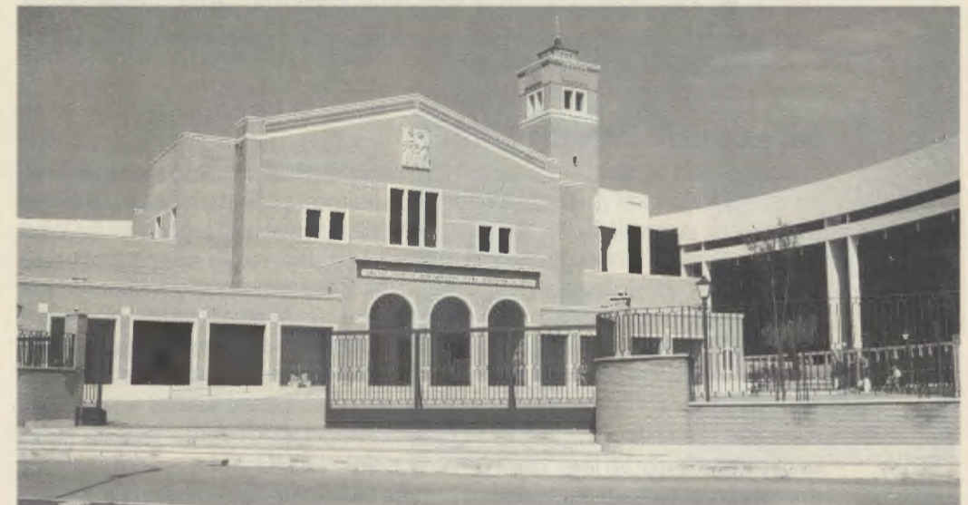
Gebouw van de parochie van de zalige Josemaría Escrivá, in een nieuwe wijk van Rome.

Kardinaal Camillo Ruini, vicaris van Zijne Heiligheid voor het bisdom Rome, informeerde de prelaat van het Opus Dei over de verschillende mogelijkheden die er in het diocees bestonden. Men koos een heel nieuwe wijk uit, Ardeatino genaamd, die gelegen is in het zuiden van de stad, niet ver van de plaats waar Sint Paulus is terechtgesteld. Op 9 november 1992 vertrouwde het vicariaat van Rome de pastorale zorg van de parochie toe aan priesters van de Prelatuur. Deze parochie begon zijn activiteiten in een klein noodgebouw. Daar werd de eerste mis op 6 juni 1993 gevierd.