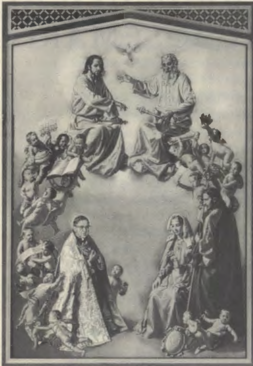
Detail van het altaarstuk. De zalige Josemaría in de hemel.