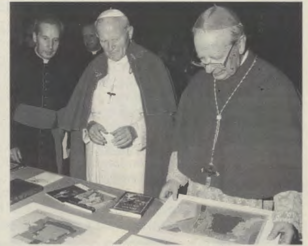
Op 17 mei 1992 liet mgr. Alvaro del Portillo, na de zaligverklaring van de stichter van het Opus Dei, aan de Heilige Vader het project van de toekomstige kerk van de zalige Josemaría zien.