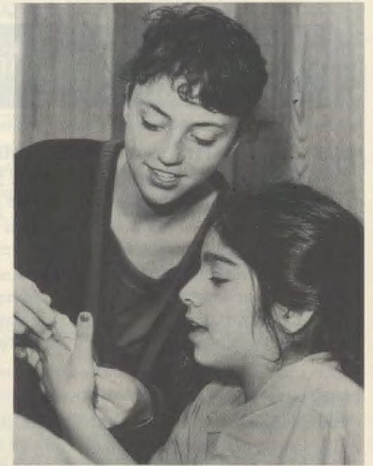
Honderden vrijwilligers komen zich wekelijks vormen en de leerlingen helpen.

Metro begon zijn werkzaamheden met 40 meisjes tijdens een zomerprogramma dat gehouden werd in een ruimte die in een winkelcentrum was gehuurd. In deze tien jaar is het Centrum aanzienlijk gegroeid. Momenteel nemen meer dan 600 leerlingen aan de verschillende programma's tijdens het schooljaar en de vakantie deel. Over enkele maanden zal Metro gaan verhuizen naar een nieuw, ruimer gebouw, beschikbaar gesteld door Midtown Educational