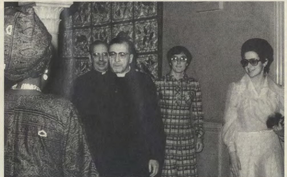
Castelgandolfo. De laatste foto van de zalige Josemaría, anderhalf uur voor zijn heengaan naar de hemel.

Zijn heengaan was als het ware het sluitzegel van de weg naar heiligheid die, door God bewogen, de zalige Josemaría in de Kerk had geopend met de stichting van het Opus Dei, op 2 oktober 1928. Dank zij zijn prediking hebben mensen van alle rassen, standen en beroepen begrepen, dat de volheid van het christelijk leven ook verkregen kan worden door middel van de gewone bezigheden van de dag, wanneer men deze maakt tot gelegenheden van ontmoeting met God en van dienstbaarheid aan de mensen. Heel zijn leven lang, tot de laatste uren hier op aarde, heeft de zalige Josemaría met zijn voorbeeld de boodschap die hij had ontvangen bevestigd: in eenheid van leven het gebed doen samensmelten met het werk en met het streven om Jezus Christus bekend te maken; de plicht van iedere dag te vervullen door het hart in God te leggen en door het oprechte verlangen het licht van Christus onder alle mannen en vrouwen te zaaien.