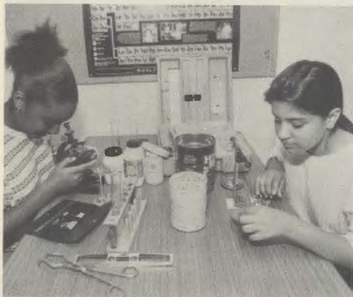
Leerlingen van de high-school tijdens een praktijkles.

De activiteiten van Metro hebben tot doel de leerlingen te helpen bij het verkrijgen van een vorming die niet alleen de ontwikkeling van de verstandelijke vermogens behelst, maar ook — en als onontbeerlijke basis — de verwerving van en groei in de menselijke en christelijke deugden. De leerlingen ontdekken aldus de waarde van het leven en de vreugde die men verkrijgt als vrucht van de inspanning om een werk tot