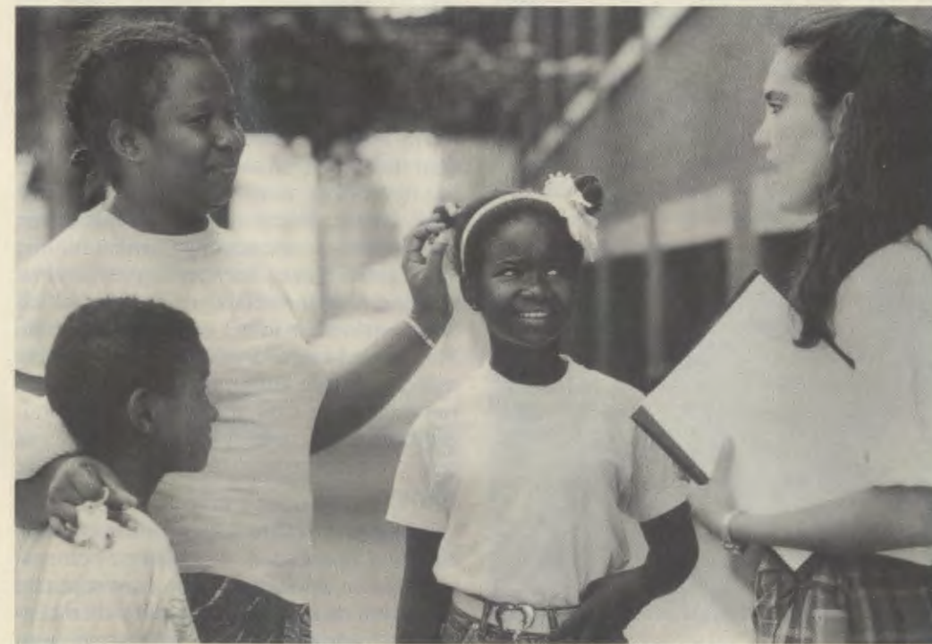
In Metro helpt men de ouders om actief deel te nemen aan de opvoeding van de kinderen.

In Gesprekken heeft hij geschreven: De vrouw is geroepen om het gezin, de burgermaatschappij, de Kerk te dragen, een kernmerkend iets dat haar eigen is en dat alleen zij kan geven: haar fijngevoelige tederheid, haar onvermoeibare edelmoedigheid, haar