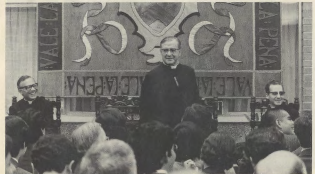
Tijdens een bijeenkomst in het Ciudad Vieja centrum, in Guatemala, op 19 februari 1975.

De reis van 1974 had hij niet kunnen afmaken: hij had ze moeten onderbreken, omdat zijn gezondheid het niet toeliet deze inspanning nog langer te laten voortduren. Maar het voornemen om de reis te vervolgen was iets dat vast stond en waarnaar hij hevig verlangde. Ik heb geen tijd meer, want dit heeft zich allemaal in snel tempo voltrokken , zei hij in Venezuela op de vooravond van zijn vertrek, en ik moet weer naar Europa gaan; maar ik kom meteen... Dan kom ik zonder haast. En dan zal ik aan iedereen zoveel tijd besteden als hij graag wil. Dat is dus afgesproken, niet waar? Afspraak van een Aragonees! (1). Deze woorden gingen in dubbele zin in vervulling: door de reis die hij het jaar daarna inderdaad kon maken, en door zijn afspraak en bescherming vanuit de hemel, vanaf enkele maanden daarna.