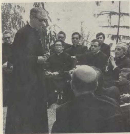
De zalige Josemaría in Guatemala, met een groep diocesane priesters, op 18 februari 1975.

Het programma dat men had voorbereid — werkvergaderingen, bijeenkomsten met duizenden mensen, bedevaarten naar