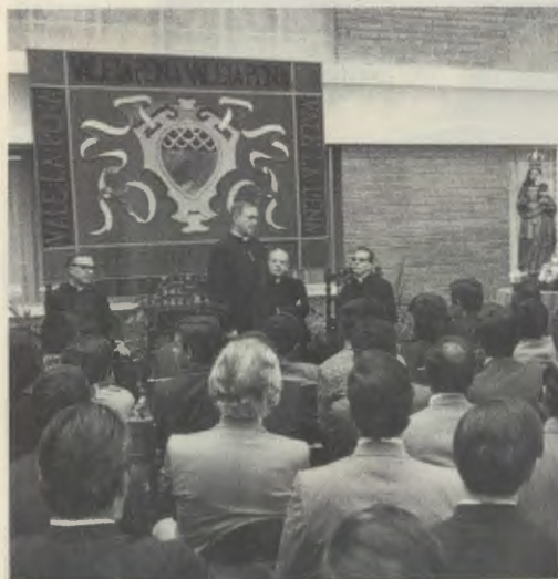
De Stichter van het Opus Dei spreekt een groep van zijn zonen in Guatemala toe, op 19 februari 1975. Dit was de naamdag van Don Álvaro del Portillo.

— Wat moet men doen om zo trouw te zijn als Don Álvaro? Er brak een daverend applaus los, waarbij de Vader zich aansloot.