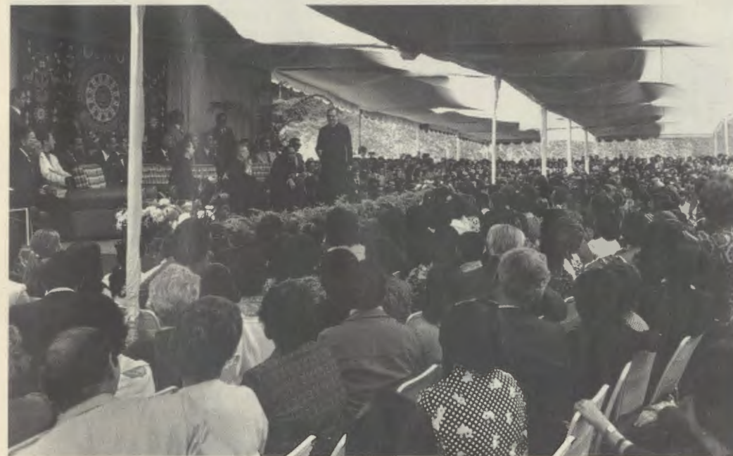
De Stichter van het Opus Dei tijdens een bijeenkomst in Altoclaro, Venezuela, op 9 februari 1975.

Juist op de 16 de begonnen de vergaderingen met verschillende groepen. Op de 18 de