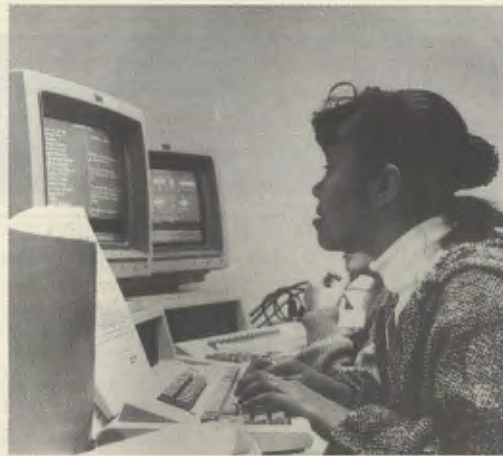
Terwijl zij zich voorbereiden op de universiteit, verwerven en vergroten de leerlingen de menselijke en christelijke deugden.

stand te brengen dat in dienst is gesteld van God en van de ander.