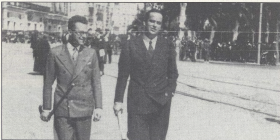
Met een vriend wandelend door Málaga.