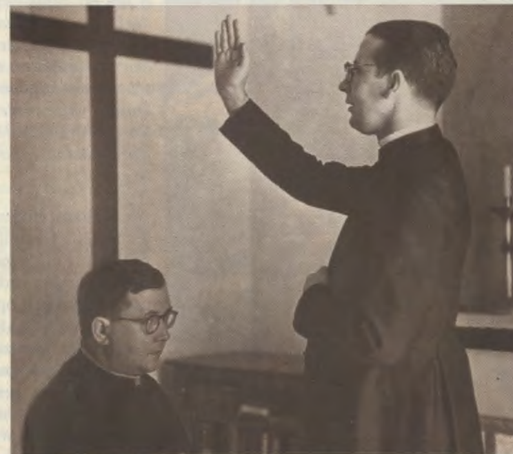
Mgr. Alvaro del Portillo, net priester gewijd, geeft de zegen aan de zalige Josemaría Escrivá de Balaguer, 26 juni 1944.