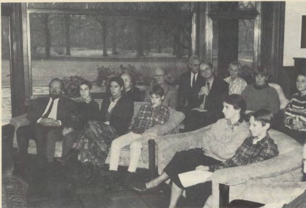
Een aandachtig gehoor tijdens een van de vele lezingen en studiedagen in het conferentieoord te Moergestel.

Een andere activiteit zijn de studiedagen over actuele aspecten van het geloof voor mensen die zich op het katholicisme willen oriënteren. Ook zijn er cursussen die meer bedoeld zijn om met andere deelnemers van gedachten te wisselen. Voorbeelden hiervan zijn dagen voor en over het gezin, met programma's voor ouders en kinderen; seminars over beroepsethiek; themabijeenkomsten.