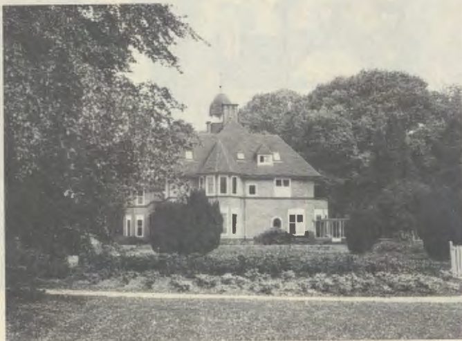
Het rondom liggende park biedt de mogelijkheid om in de natuur alles te laten bezinken en nieuwe inspiratie te zoeken.

Sinds 1986 organiseert de Prelatuur van het Opus Dei in dit centrum activiteiten met een godsdienstige inhoud. Maar niet alleen dat. Geloof, familie, studie en beroep, waarden en normen, filosofie en ethiek, wetenschap en cultuur zijn allemaal