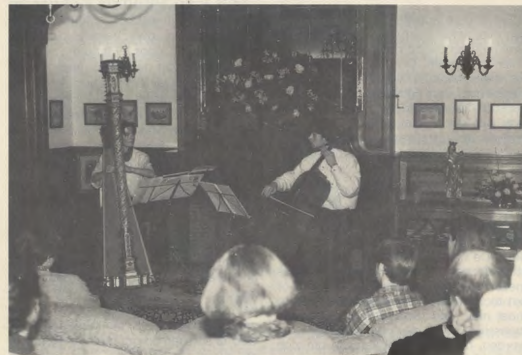
In Zonnewende worden allerlei culturele activiteiten georganiseerd. Hier wordt aan jonge musici de kans geboden hun kwaliteiten te tonen.

Er is gelegenheid in de kapel, waar dagelijks de Eucharistie wordt gevierd, in stilte te mediteren of te lezen, een gesprek te hebben met de priester, te biechten en klassieke geestelijke boeken van de bibliotheek te raadplegen. Het bijbehorende park, dat ruimte en rust ademt, biedt de mogelijkheid om in de natuur alles te laten bezinken en nieuwe inspiratie te zoeken.