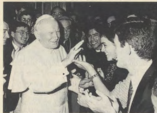
Paus Johannes Paulus II tussen de deelnemers tijdens de slotbijeenkomst van het theologisch symposium.

3. Het diepe bewustzijn waarmee de huidige Kerk opmerkt dat zij ten dienste staat van een verlossing die alle dimensies van het menselijk bestaan aangaat, is onder de leiding van de heilige Geest voorbereid met een geleidelijke intellectuele en geestelijke vooruitgang. De boodschap van de zalige Josemaría, waaraan u de dagen van uw