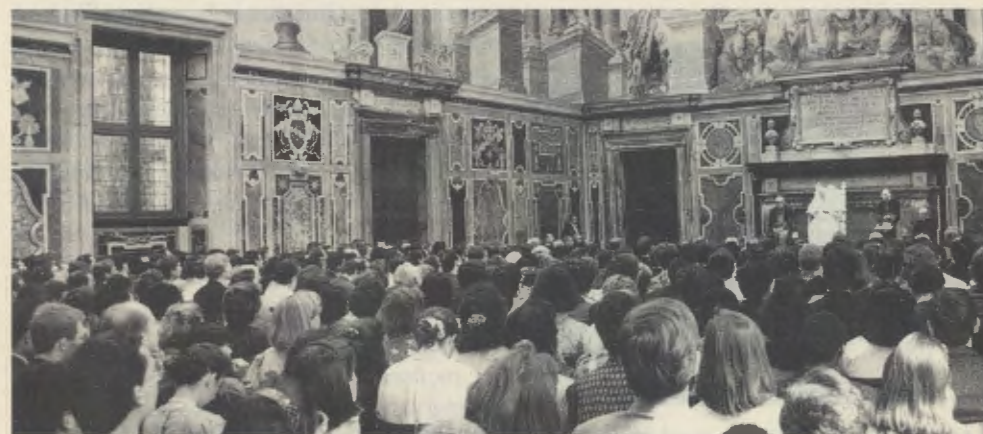
Rome, 14 oktober 1993. Paus Johannes Paulus II richt het woord tot de deelnemers aan het theologisch symposium over de leer van de zalige Josemaría Escrivá.

Op 14 oktober werden de 500 deelnemers aan het symposium in audiëntie ontvangen door Paus Johannes Paulus II. We nemen hier de woorden op van de rede die de Paus uitsprak tot de deelnemers aan het symposium.