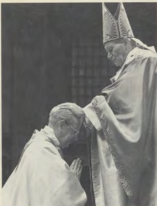
Rome, 6 januari 1991. De bisschopswijding van mgr. Alvaro del Portillo.

Zondag, 25 juni 1944, was een grote feestdag. Naar verwachting was de kapel van het bisschoppelijk paleis te klein voor alle aanwezigen. Na de heilige Mis ging men naar de sacristie om, vaak met grote ontroering,