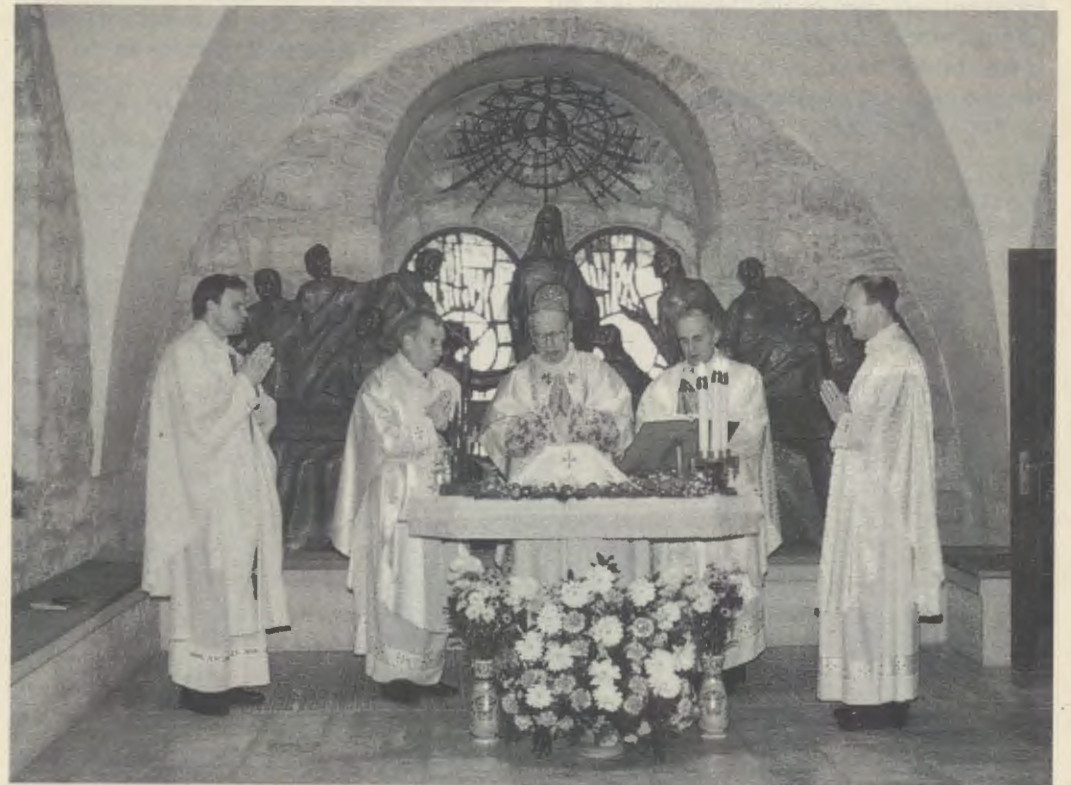
Jerusalem, 22 maart 1994. Mgr. del Portillo viert zijn laatste Mis in de kerk van het Cenakel.