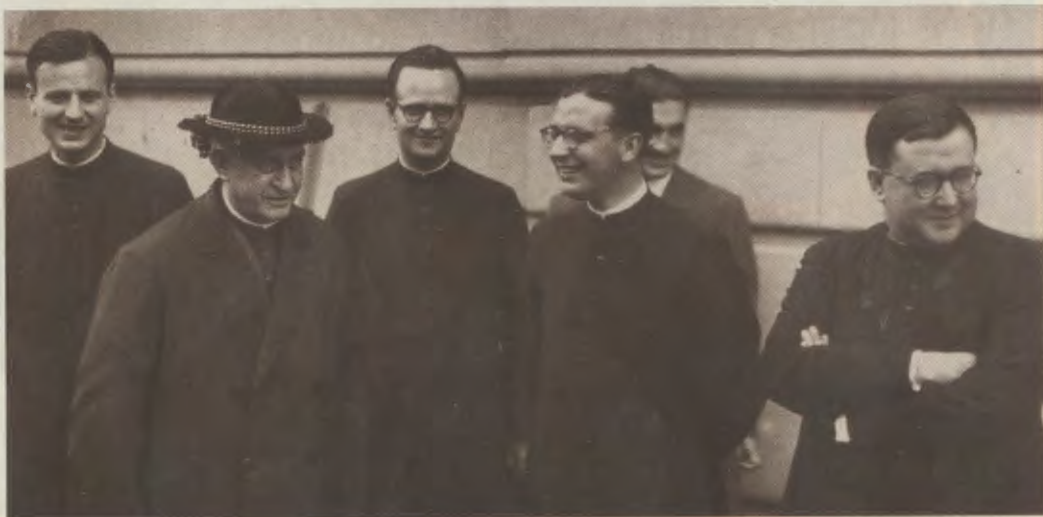
De stichter van het Opus Dei met de bisschop van Madrid en zijn drie eerste priesterzonen van het Werk, op 25 juni 1944.