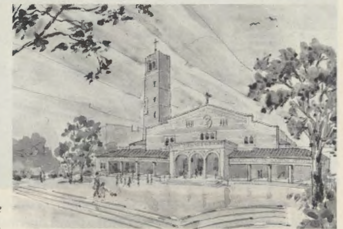
Schets van de nieuwe parochiekerk.

De kerk zal worden gebouwd op een terrein dat aan het bisdom geschonken was. Het ligt in een van de nieuwe buitenwijken van de stad, dicht