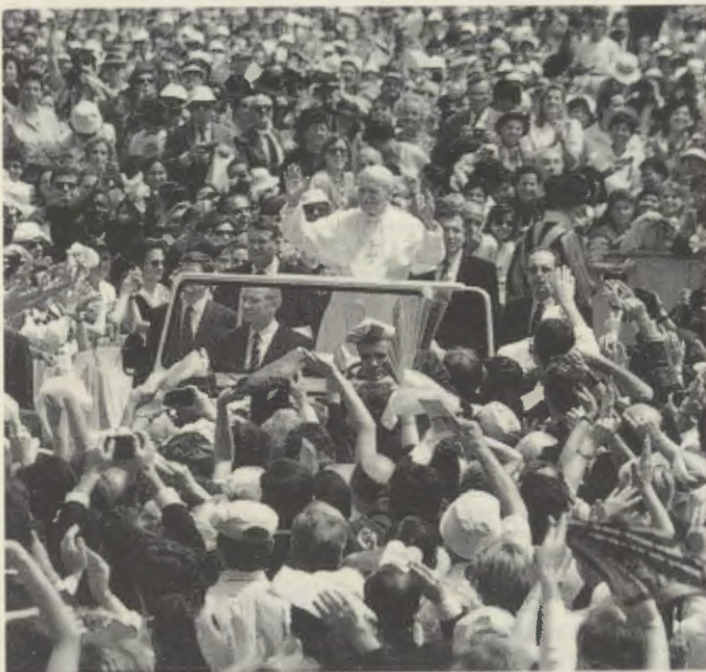
De Heilige Vader tussen de pelgrims op 18 mei 1992.

De omvang van de verspreiding van de boodschap van de zalige Josemaría Escrivá in alle milieus van de maatschappij geeft aan dat zijn leven en zijn leer een doeltreffend uitgangspunt vormen voor de nieuwe evangelisatie waartoe de Heilige Vader alle christenen oproept. De actualiteit van de geest van de stichter van het Opus Dei is inderdaad door veel vertegenwoordigers van de kerkelijke hiërarchie met instemming naar voren gebracht. De pauselijke documenten van het zaligverklaringsproces benadrukken de vruchtbaarheid van zijn leer voor de hele Kerk. In het document van de zaligverklaring lezen wij: "In het verkondigen van de radicaliteit van de roeping vanuit het doopsel opende hij nieuwe horizonten voor een diepere kerstening van de maatschappij (...). Josemaría Escrivá heeft de gehele verlossende kracht van het geloof getoond en de energie ervan om zowel de mensen als de structuren, waarin de idealen en de verlangens van de mens tot uitdrukking komen, te veranderen".