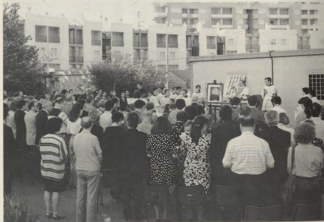
26 juni 1993. Eerste Mis ter ere van de zalige Josemaría Escrivá op de plaats waar de gebouwen van de nieuwe parochie zullen worden opgetrokken.