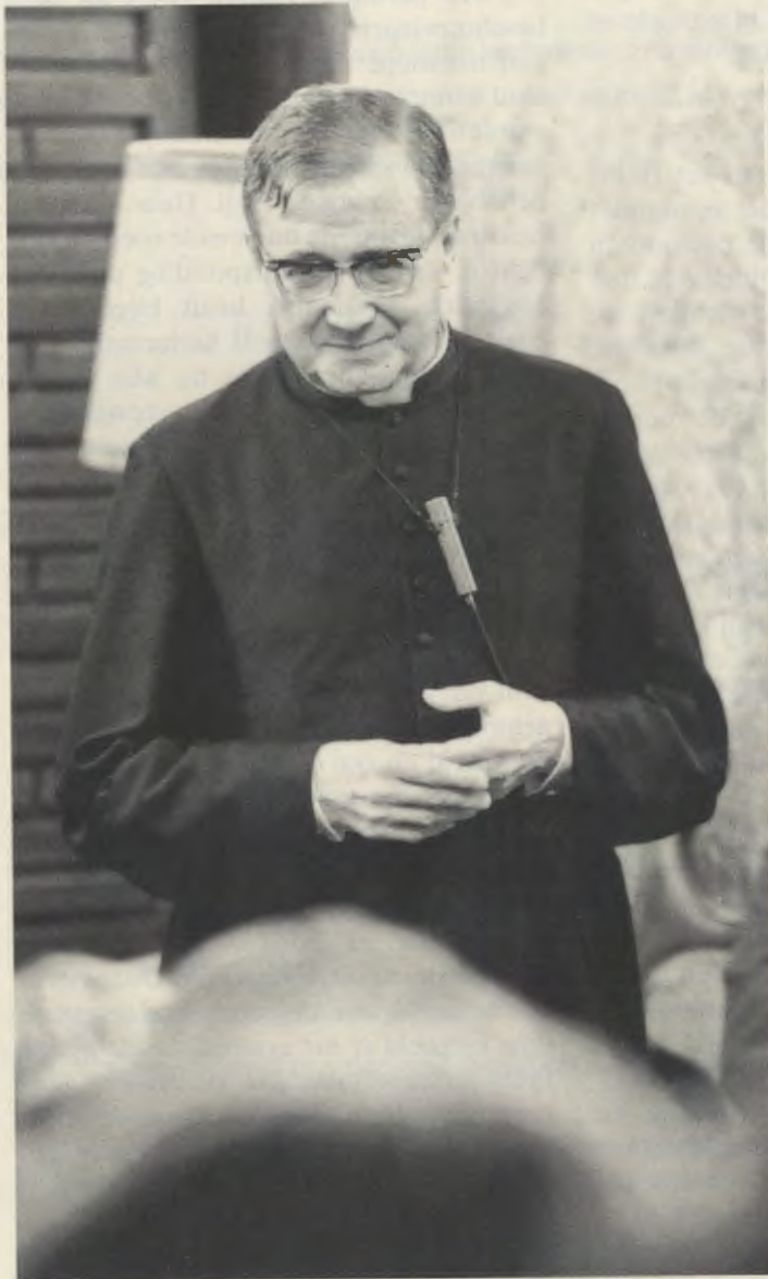
De zalige Josemaría tijdens een informeel samenzijn.

Op het eind van het symposium verleende paus Johannes Paulus II een audiëntie aan de 500 deelnemers. Daar zei hij o.a. het volgende: "Het diepe bewustzijn waarmee de huidige Kerk opmerkt dat zij ten dienste staat van een verlossing die alle dimensies van het menselijk bestaan