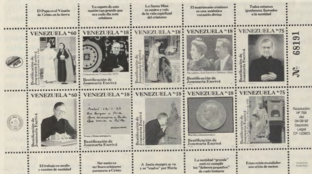
De Posterijen van Venezuela hebben een reeks herdenkingszegels van de zaligverklaring uitgegeven.

De zalige Josemaría heeft altijd gezegd dat, hoewel de roeping tot het Opus Dei iets anders is dan de roeping tot het kloosterleven, wie geen diepe liefde en eerbied voelt voor de religieuze staat niet de geest van het Opus Dei heeft. In zijn leven heeft hij vele religieuzen bijgestaan en talloze jongeren geholpen hun roeping tot het religieuze leven te ontdekken. Na zijn overlijden ontving de Postulatie van het Opus Dei veel dankbetuigingen van kloostergemeenschappen die roepingen hebben