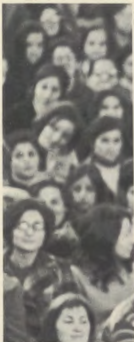
Tijdens een bijeenkomst te B

In een zeer onrust de overtuiging kwam een innerlijke vrede e haar leven op aan G paar uur, en om zeve te gaan : op dat mom verdwenen was. Hoev dat de tumor door d bevuild waren. Ze zag pantoffels wilde aand verdwenen was.