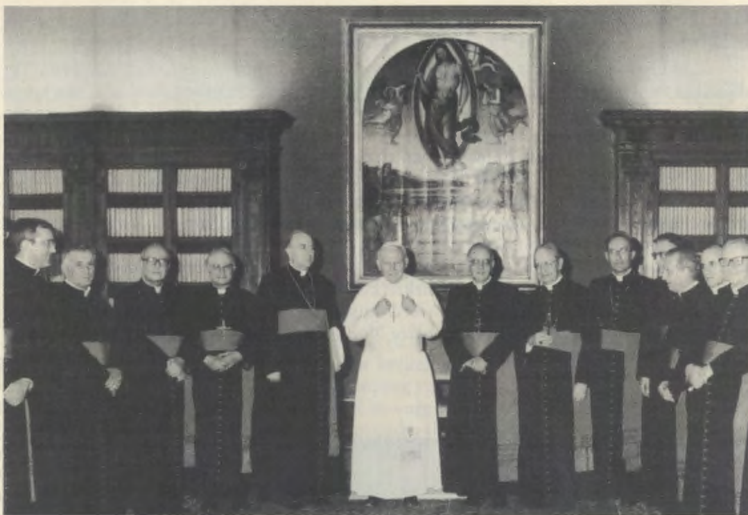
6 juli 1991, na de lezing van het Decreet over het wonder toegeschreven aan de voorspraak van de Eerbiedwaardige Josemaría Escrivá.

Op het moment dat de gezwellen verdwenen, verbeterde deze tweede ziekte ook op plotselinge en onverklaarbare wijze en verdween definitief. Dezelfde raad stelde vast dat de prognose zeer ongunstig was quoad vitam en quoad valetudinem (wat het leven en de gezondheid betreft).