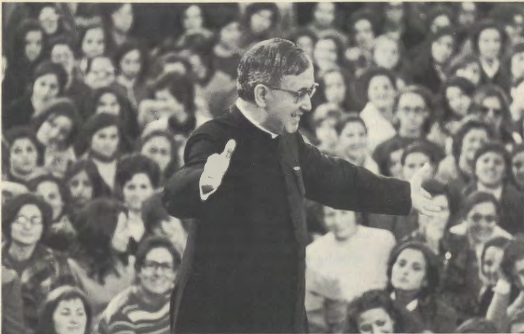
Tijdens een bijeenkomst te Brafa, Barcelona (Spanje) op 25 november 1972.