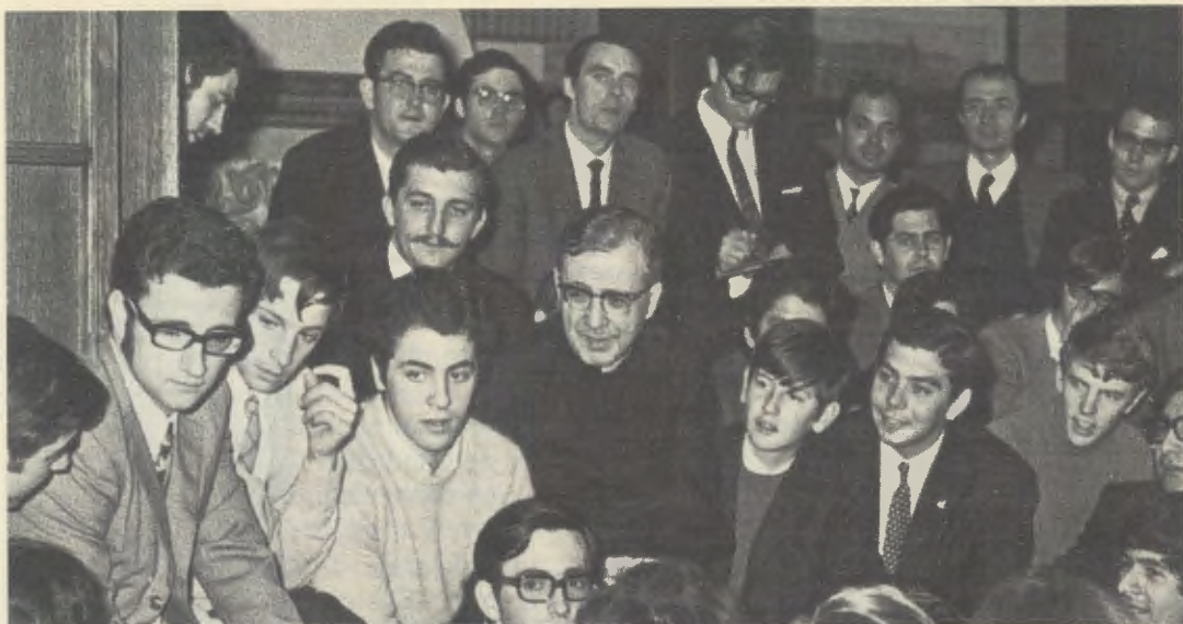
Rome: 26 maart 1970.