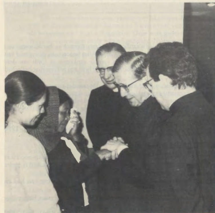
Met een vrouw uit het platteland in juni 1970 (Mexico).

overlijden enig verband kan hebben met de aandoening waarvan zij wonderbaarlijk is genezen.