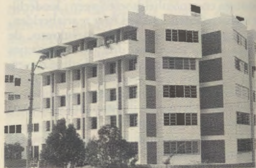
Het hoofdgebouw van het IFES.

In februari 1985, enkele maanden voor zijn overlijden, verbleef Mgr. Escrivá, een aantal dagen in Guatemala, aan het einde van zijn derde katechesereis door Zuid-Amerika. Zoals voordien, kwam ook deze reis neer op een overvloedig uitzaaien van de christelijke leer: aangezet door zijn verlangen de Kerk almaar edelmoediger te dienen, moedigde de Dienaar Gods zijn dochters en zonen aan tot een uitgebreid en vruchtbaar apostolaat, erop gericht de hele maatschappij op een christelijke wijze te verlichten. Tijdens die dagen zegende hij met hoopvolle verwachting een stuk grond ten zuiden van de hoofdstad van Guatemala, waarop de gebouwen van het IFES ( Instituto Femenino de Estudios Superiores ) zouden worden opgetrokken. Het eerste gebouw, dat in 1964 ingehuldigd werd, was te klein geworden voor het groeiend aantal leerlingen en de ontwikkeling van nieuwe initiatieven.