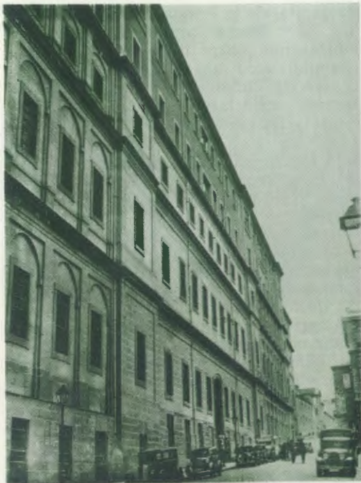
De voorgevel van het Hospital General te Madrid, zoals die er in de jaren dertig uitzag. Op de achtergrond is de kerk van het Patronaat van Sint Elisabet zichtbaar, waar de Dienaar Gods als rector werkzaam was.

gewone christen — als hun vijand beschouwden. Eerst moest men met genegenheid en vriendelijkheid het wantrouwen overwinnen, om dan de vooroordelen weg te nemen en de mensen moed in te kunnen spreken door hun wat vreugde te brengen.