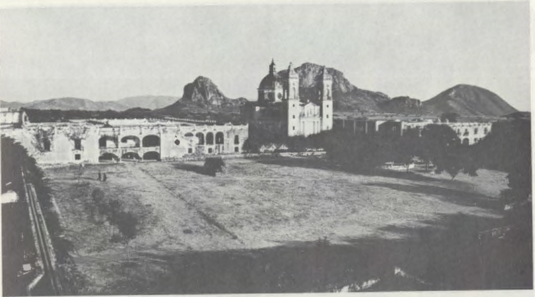
Gezicht op Montefalco (Jonacatepec, in de staat Morelos, Mexico) in 1967.

y Deporte » (Platteland en Sport) genaamd, eigenares van het landgoed, om de leiding van dit apostolaatswerk aan het Opus Dei toe te vertrouwen, en over de belangstelling die Mgr. Escrivá de Balaguer ervoor toonde.