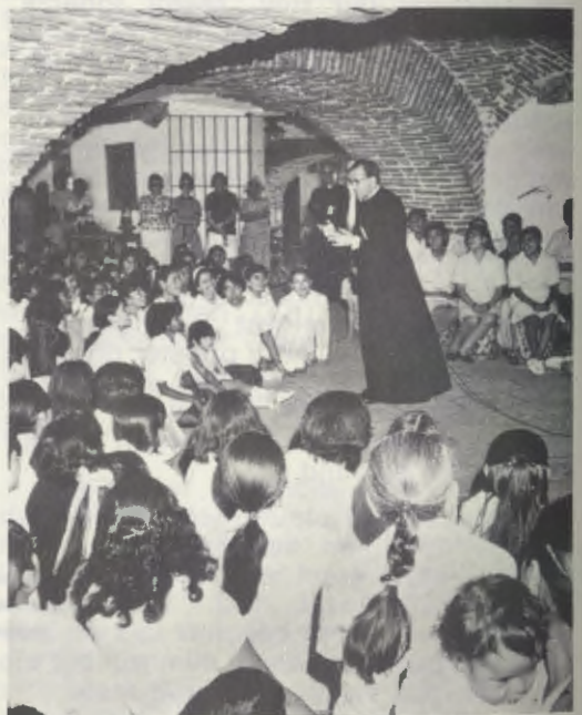
Mgr. Escrivá in gesprek met een groep plattelandsvrouwen op de Landbouwschool van Montefalco in juni 1970.

Na een reis van bijna honderd km van uit Mexico D.F. over een geasfalteerde weg, trokken wij verder door het dal van Amilpas, over een landweg. Verscheidene leden van het Opus Dei vergezelden mij op deze reis en spraken met hooggespannen verwachtingen over het aanbod van een stichting « Campo