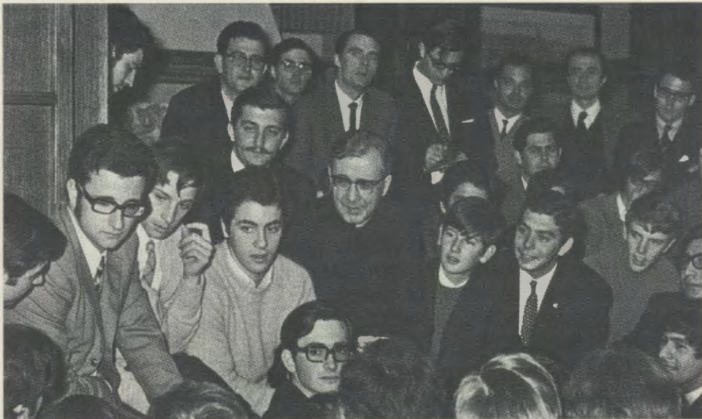
Der Gründer des Werkes im angeregten Gespräch mit Jugendlichen am 26. März 1970 in Rom.