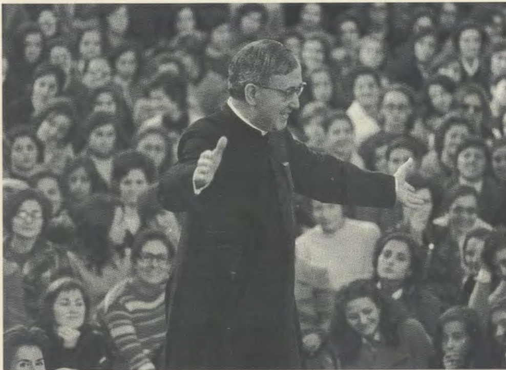
Der Gründer des Opus Dei Josemaría Escrivá in einem Beisammensein am 25. November 1972 in Barcelona.