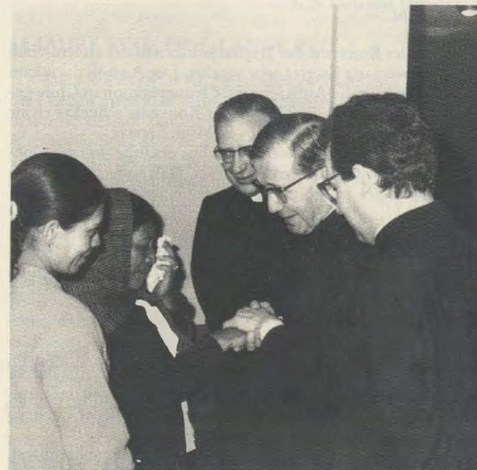
Der ehrwürdige Diener Gottes begrüßt eine arme mexikanische Bäuerin (Juni 1970 in Mexiko).