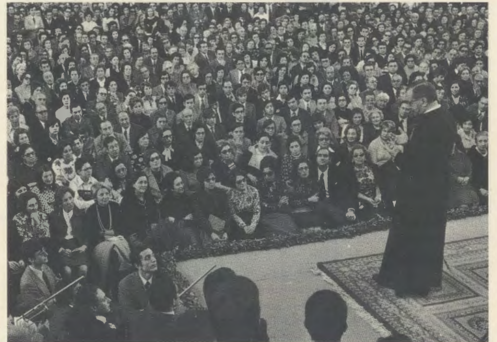
In einem Beisammensein am 22. November 1972 in Barcelona spricht der Diener Gottes zu vielen Personen.