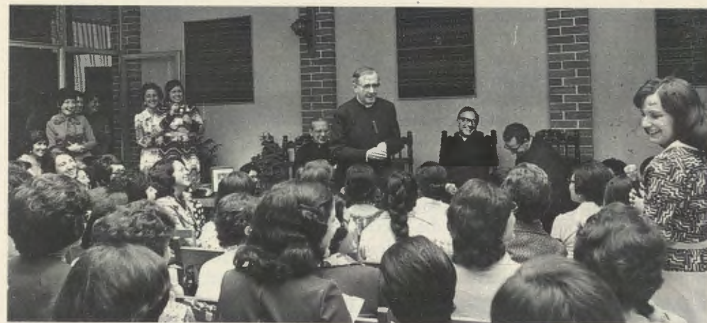
Guatemala 1975. In einem Bildungszentrum für Frauen.

»Dr. Escrivá ist ein mustergültiger Priester, von Gott ausersehen, viele Seelen zum Heil zu führen; bescheiden, klug, selbstlos, seinem Bischof gegenüber bedin-