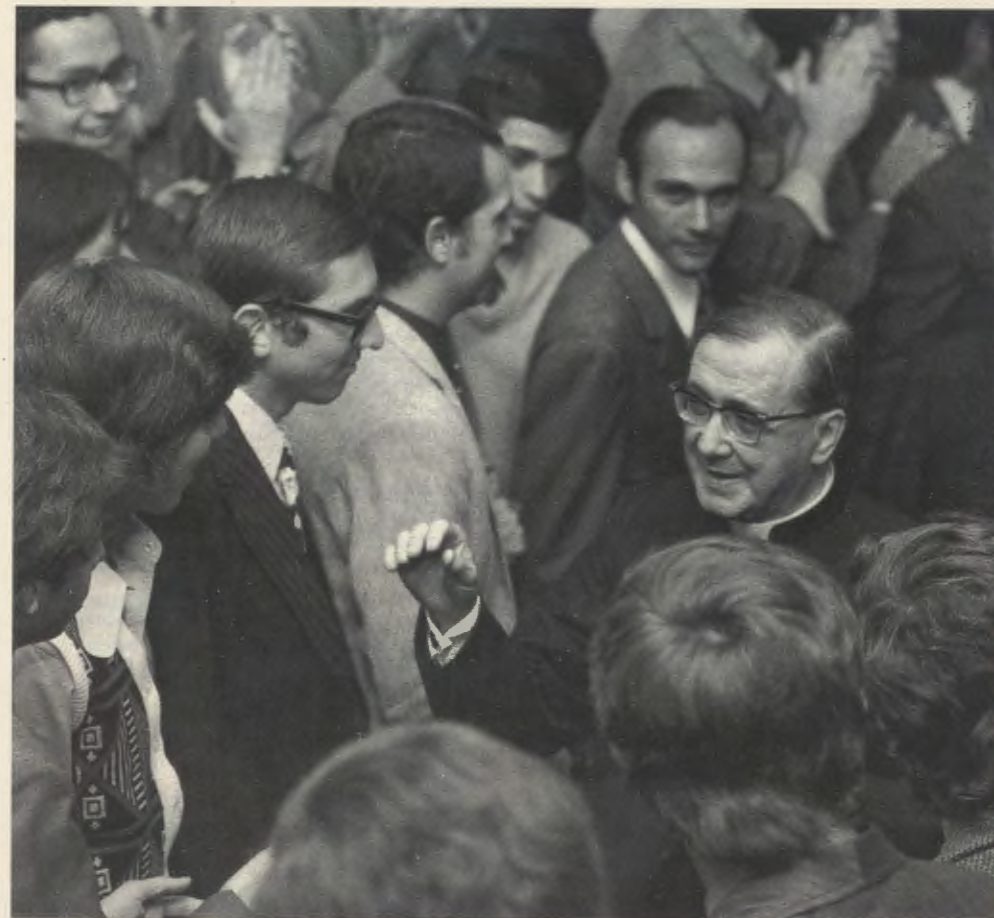
1974 in São Paulo, Brasilien.