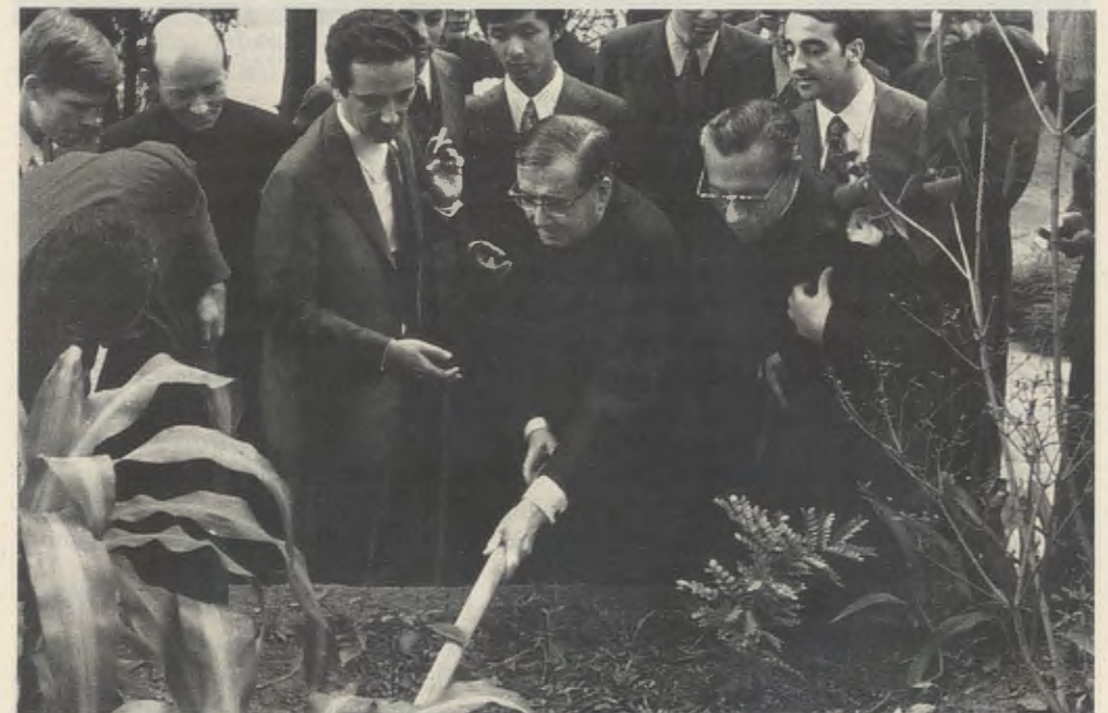
Der Gründer des Opus Dei 1974 in Aroeira in Brasilien.

»Alle, die das Glück hatten, ihn zu kennen, werden bestätigen, daß er, als er dreiundsiebzigjährig im Jahre 1975 starb, noch sehr jung war. Er war mit der Zeit nicht gealtert. Im Gegenteil: Jahr für Jahr wurde sein Geist jünger und erfüllter von einer unglaublich jugendlichen Vitalität und Freude. All dies geschah nicht von selbst, sondern war das Ergebnis eines lebenslangen heroischen Kampfes, der ihn Gott täglich näherbrachte.« ( Opus Dei in Africa: A force for Good , in: »Sunday Nation«; Nairobi, 3. 2. 1980)