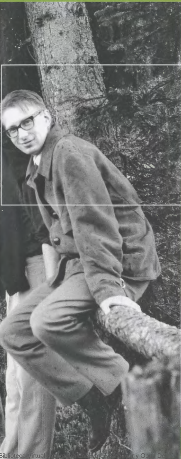
En una excursión a la montaña, en el año 1962.