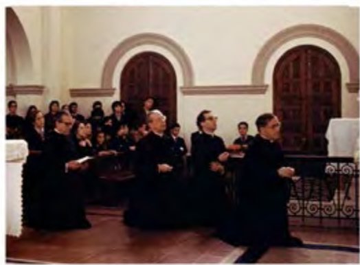
SAN JOSEMARÍA, DON ÁLVARO DEL PORTILLO Y UN GRUPO DE FIELES REZANDO EN EL SANTUARIO DE LO VÁSQUEZ

Allí de rodillas y con el templo repleto de gente, se rezó el rosario con pausa y devoción.