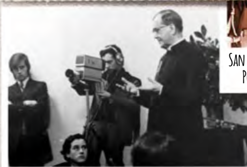
EL BACKSTAGE DE UNA TERTULIA EN ALAMEDA