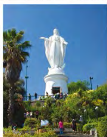
EL SANTUARIO DEL CERRO SAN CRISTÓBAL FUE VISITADO POR SAN JOSEMARÍA EL JUEVES 4 DE JULIO DE 1974

A pesar de que llovía torrencialmente ese día, hasta allí llegó san Josemaría y dentro del auto a los pies de Nuestra Madre rezó el Santo Rosario.