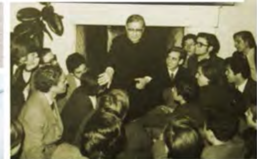
GRUPO DE ESTUDIANTES ESCUCHA ATENTAMENTE A SAN JOSEMARÍA