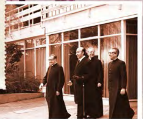
SAN JOSEMARÍA, UN FUNCIONARIO DE PROTOCOLO, DON ÁLVARO DEL PORTILLO Y DON ADOLFO RODRÍGUEZ A LA LLEGADA AL AEROPUERTO

En las afueras de Lo Barnechea se construyó la primera casa de retiros y convivencias del Opus Dei en Chile y en América. El 6 de julio el Padre estuvo allí y plantó un cedro del Líbano en el jardín. También consagró el altar del oratorio.