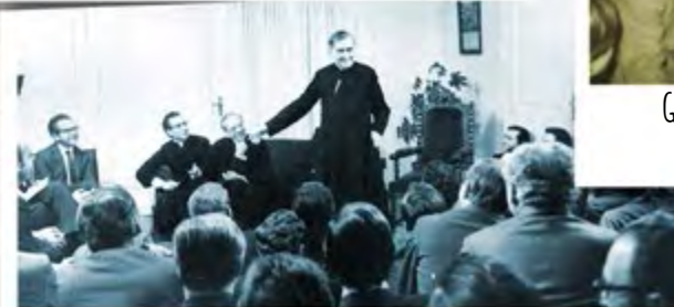
SAN JOSEMARÍA EN UNA TERTULIA EN ALAMEDA