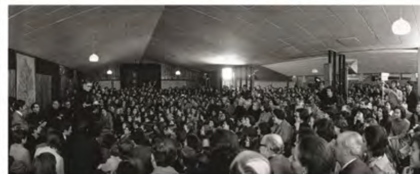
UNA DE LAS TANTAS REUNIONES QUE SE REALIZARON EN EL COMEDOR