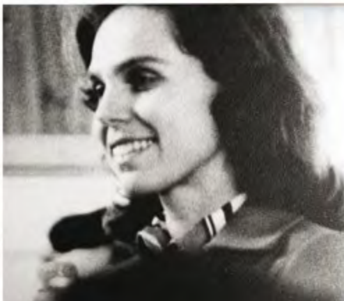
MARÍA TERESA PREGUNTÁNDOLE A SAN JOSEMARÍA CÓMO RECURRIR AL ESPÍRITU SANTO EN EL TRABAJO PERIODÍSTICO

“TÚ SIENTES, COMO SIENTO YO, LA VACILACIÓN, LA DUDA: QUE PUEDO IR PARA LA DERECHA, PARA LA IZQUIERDA; QUE PUEDO HABLAR DE ESTO O CALLARME. YO LO NOTO PERFECTAMENTE, EN ESTE MISMO MOMENTO. Y TÚ TAMBIÉN, CUANDO ESCRIBES O CUANDO HACES UN REPORTAJE, ¿VERDAD? PUES, DÉJATE LLEVAR DEL ESPÍRITU SANTO. DECÍDETE POR LO MÁS ARDUO, SIEMPRE QUE SEA BUENO Y NOBLE. Y ENTONCES SEGUIRÁS EL EMPUJÓN DEL ESPÍRITU SANTO, Y ÉL TE AYUDARÁ”.