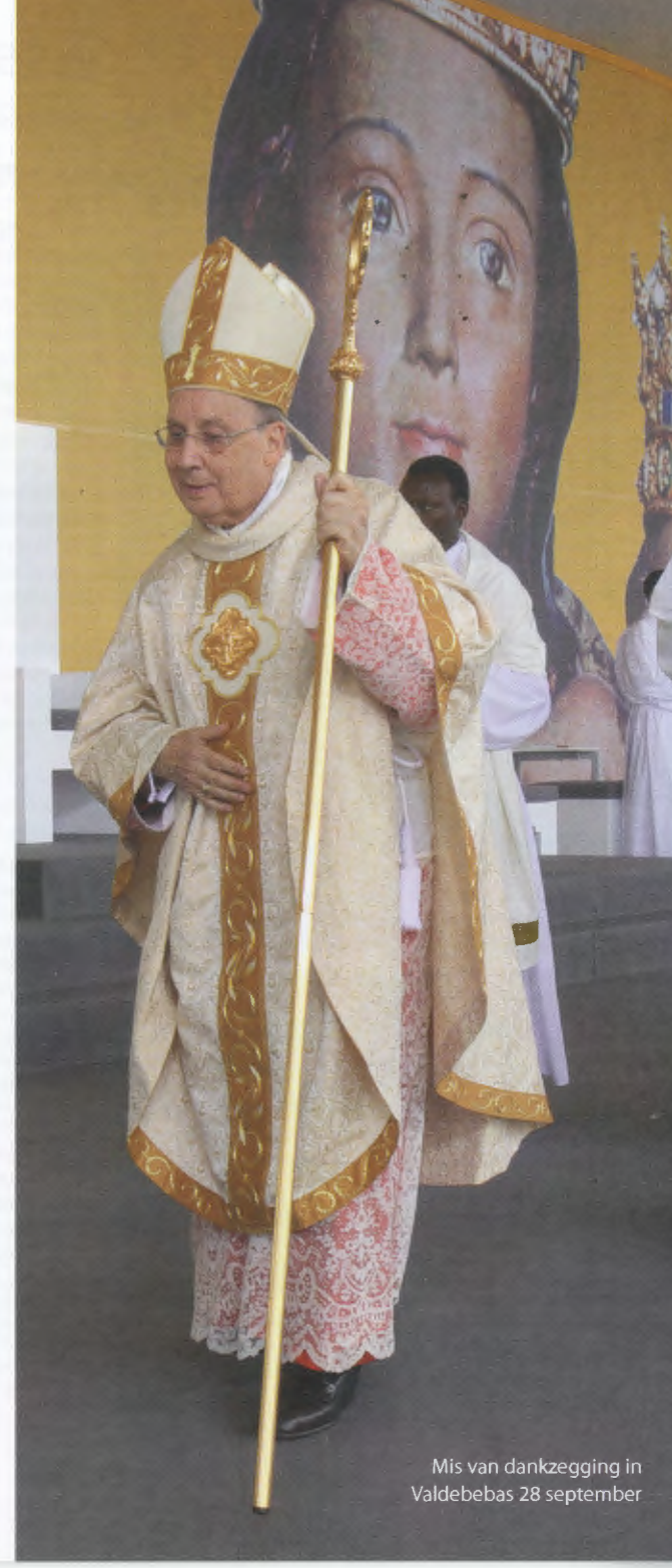
Mis van dankzegging in Valdebebas 28 september