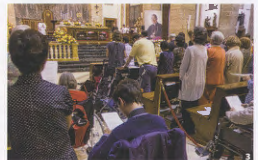
1 De basiliek van San Eugenio 29 September. 2 De kist van de zalige Álvaro in de basiliek van San Eugenio. 3 San Eugenio in de dagen na de zaligverklaring.

beste teken van dankbaarheid is, een goed gebruik te maken van de ontvangen gaven» 11 . Hij hield nooit op, in zijn prediking, in bijeenkomsten, bij persoonlijke ontmoetingen, overal, over apostolaat en evangelisatie te spreken. Om deze liefde van God die wij hebben ontvangen niet te verliezen, moeten wij deze met de anderen delen; de goedheid van God is erop gericht zich te verspreiden. Paus Franciscus heeft gezegd dat «de Heer ons deze liefde in het gebed doet ervaren, maar ook door middel van talrijke tekenen die wij in ons leven kunnen lezen, door middel van talrijke personen die Hij op onze weg plaatst» 12 .