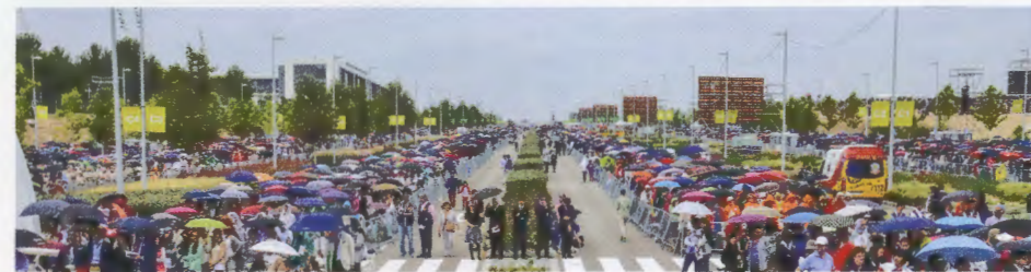
28 september: zonder bang te zijn voor de regen.

Zijn zaligverklaring zal plaats hebben in Madrid, de stad waar hij geboren werd, waar hij zijn kinderjaren en zijn jeugd heeft doorgebracht. Daar werd zijn bestaan gesmeed in de eenvoud van het gezinsleven, in de vriendschap en de dienst aan de anderen, zoals het in de buitenwijken gaan helpen bij de menselijke en christelijke vorming van zovele mensen in nood. Daar vooral had de gebeurtenis plaats die een definitieve wending gaf aan zijn leven: de ontmoeting met de heilige Jozefmaria Escrivá, van wie hij leerde om elke dag meer verliefd te raken op Christus. Ja verliefd raken op Christus. Dit is de weg van de heiligheid die elke christen dient te bewandelen: zich laten beminnen door de Heer, het hart openen voor zijn liefde en toestaan dat Hij degene is die ons leven leidt.