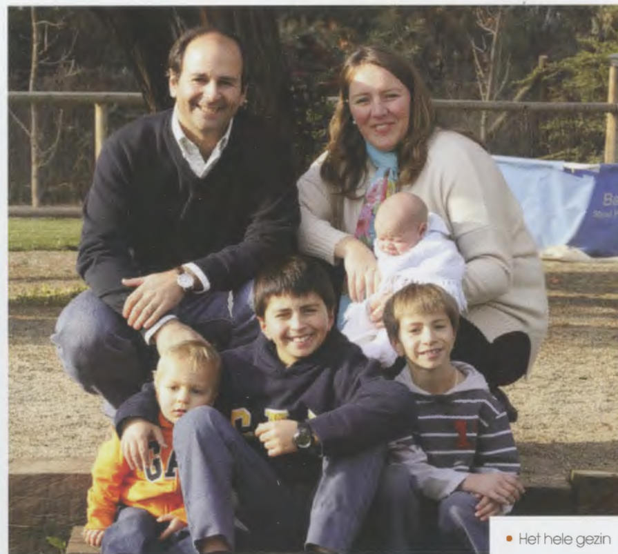
• Het hele gezin