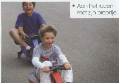
• Aan het racen met zijn broertje.