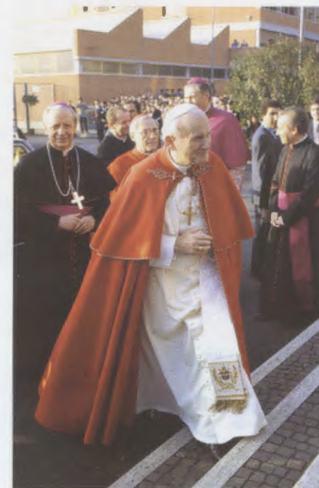
• Bezoek van de Heilige Vader aan het ELIS-centrum in Rome (1984).

Mgr. Echevarría dankte hem in naam van het Opus Dei voor deze blijk van grote waardering. De zalige Johannes Paulus II antwoordde in het Italiaans dat hij dit als zijn plicht zag. Si doveva, si doveva , luiden zijn woorden.