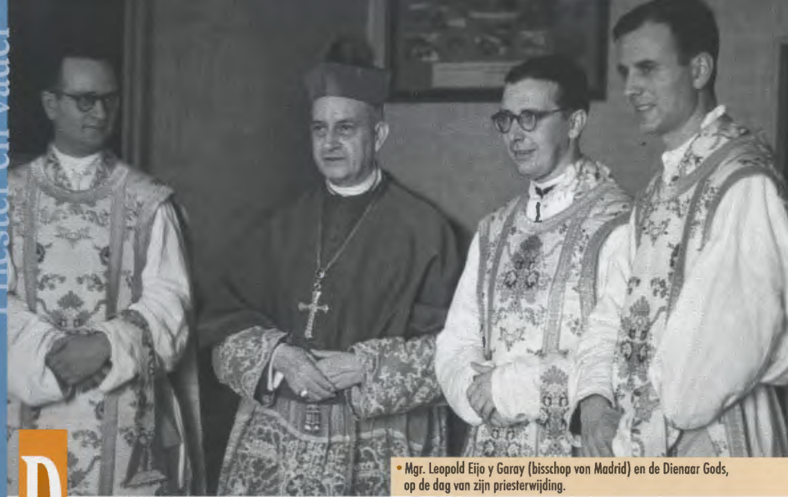
• Mgr. Leopold Eijo y Garay (bisschop van Madrid) en de Denaar Gods, op de dag van zijn priesterwijding.