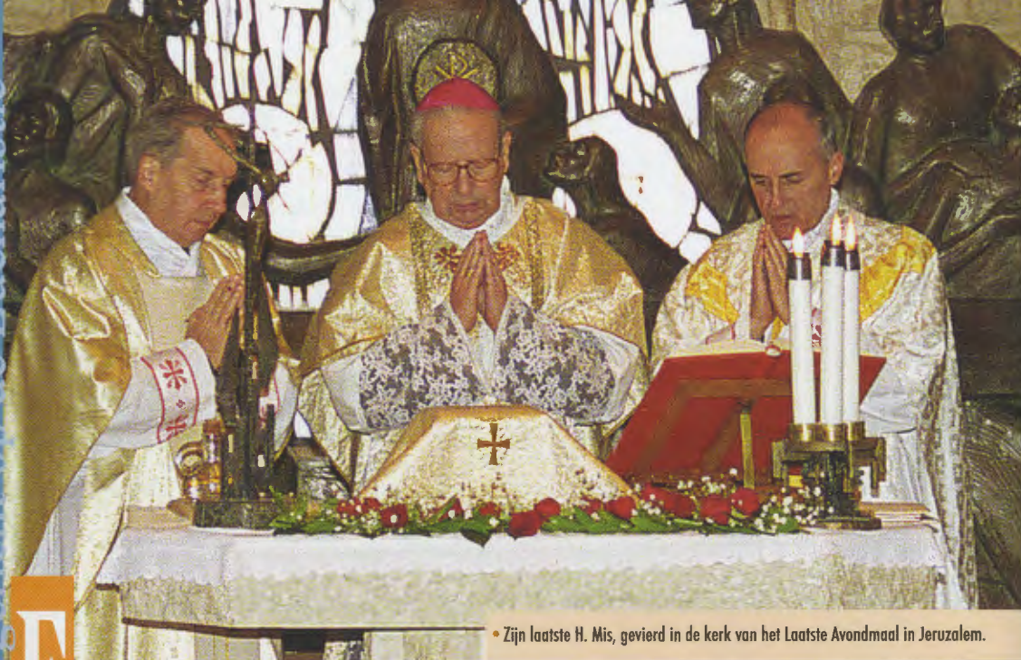
• Zijn laatste H. Mis, gevierd in de kerk van het Laatste Avondmaal in Jeruzalem.