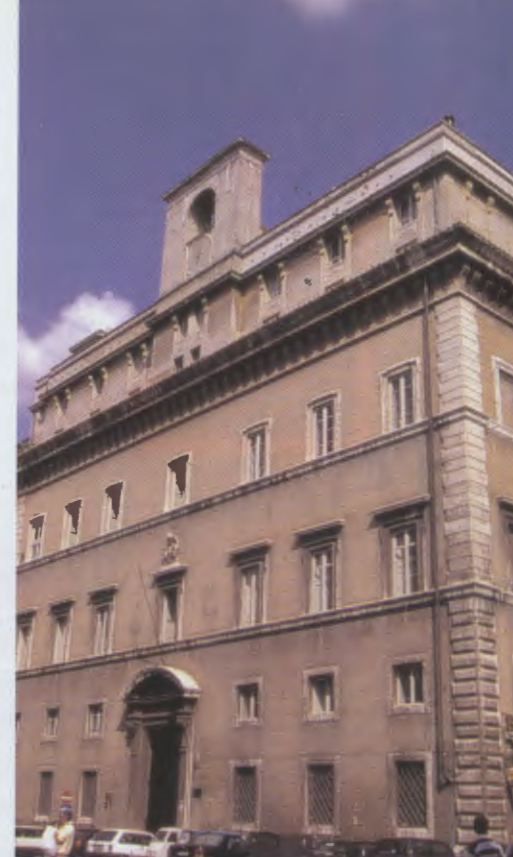
• Palazzo Sant'Apollinare, Sitz der Päpstlichen Universität vom Heiligen Kreuz.

Inzwischen sind weitere flankierende Institutionen entstanden, die die Arbeit der Universität unterstützen. Seit fünfzehn Jahren besteht ein „Centro Académico Romano Fundación“, das Wohltäter aus der ganzen Welt versammelt. Bezugnehmend auf jene, die so eine finanzielle Hilfe leisten, sagte vor kurzem der Prälat des Opus Dei, Bischof Echevarría: „Ohne deren Hilfe, die – ob groß oder klein – immer Ausdruck der Liebe zu Gott und der Wertschätzung des Priestertums sind, wäre all das Gute unmöglich, das hier im Dienste der Kirche getan wird.“