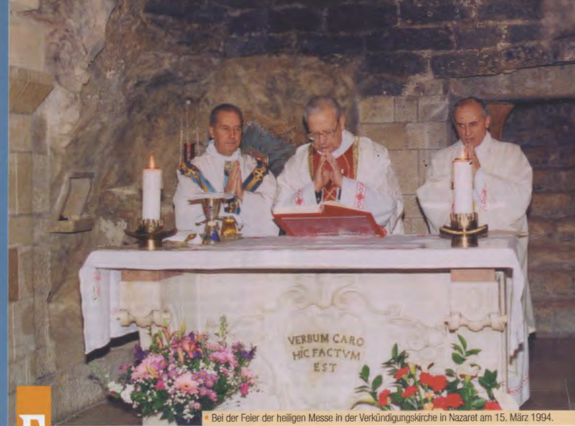
• Bei der Feier der heiligen Messe in der Verkündigungskirche in Nazaret am 15. März 1994.