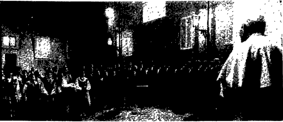
Un momento dell'incontro di ieri sera a Castel Gandolfo

Con gli artisti del coro; sono stati ricevuti dal Papa anche pellegrini di Nowy Targ ai quali Giovanni Paolo II ha chiesto di salutargli gli amati monti Tatra