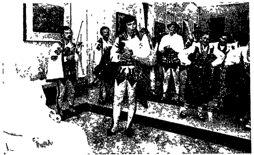
I due momenti dell'incontro del Santo Padre con il gruppo folkloristico «Skalni» dapprima alle ore 13 dopo l'Angelus, poi dopo le ore 20 nella Sala degli Svizzeri. Nella foto in alto durante l'incontro del mattino i giovani offrono in dono al Papa un artistico crocifisso in legno

Soffia il vento dai monti Tatra e i giovani scendo a valle dice il ritornello di un antico canto montano della regione polacca del Podhale. A valle c'è Cracovia c'è la possibilità di studiare, di avviarsi verso una vita diversa da quella dei padri. Ma gli studi e la vita diversa non devono cancellare le antiche tradizioni culturali della gente della montagna. E nato così venticinque anni fa Cracovia un gruppo folkloristico giovanile dal nome Skalni (che in polacco vuol dire quelli della pietra cioè quelli dei monti). Ne fanno parte studenti figli di montanari di Zakopane Bukovina Poronin Koscielisko Chocholow che perpetuano con danze e canti di alta professionalità il ricco patrimonio delle tradizioni locali. Immortali come labete rosso le ha definite il poeta montanaro Józef Pitorak diffondendole anche all'estero. Sorto nell'ambito dell'Accademia di Agricoltura cracoviana il gruppo studentesco Skalni si è distinto in un quarto di secolo in numerosi festival nazionali e internazionali specializzati Gdansk todz Lilla Lublino Zakopane Guadalupe Efez (Turchia) e si è esibito con successo in molti Paesi europei ed extra europei. Quest'anno ha partecipato al festival di Mesina a fianco di altri noti complessi di fama mondiale