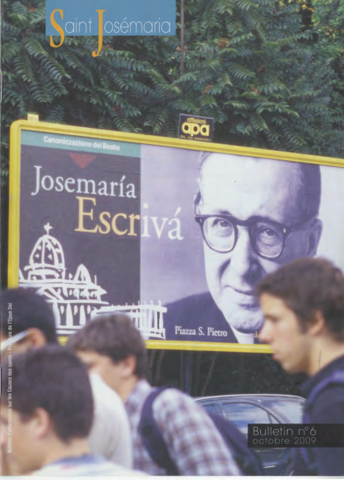
Bulletin d'information sur les Causes des saints - Prélatrice de l'Opus Dei