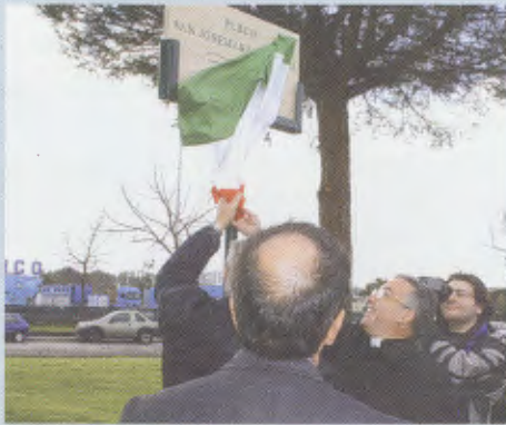
Inauguration du parc "saint Josémaria Escriva" à Latina, au sud de Rome