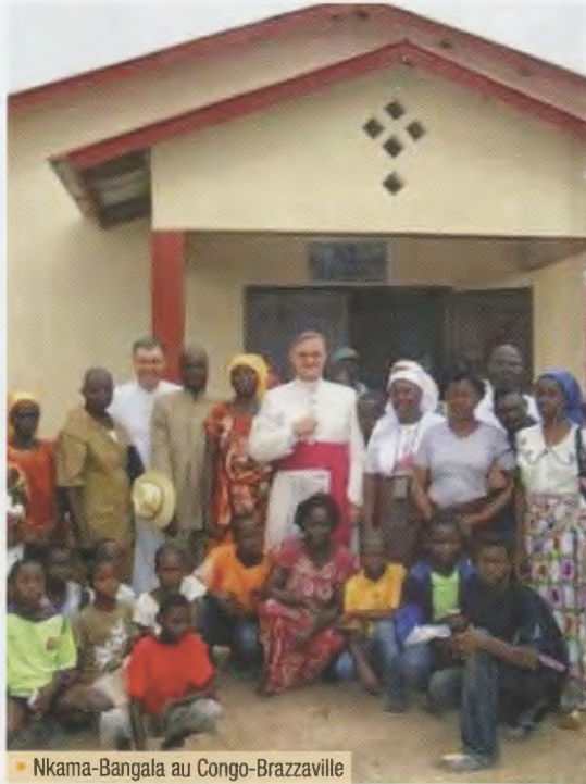
• Nkama-Bangala au Congo-Brazzaville

Au début de l'année 2009, pendant trois jours, une quinzaine de pèlerins ont visité Rome dans le sillage du fondateur de l'Opus Dei, au cours d'un voyage organisé par l'Association "Les Amis de Josémaria Escriva". Les pèlerins ont pu suivre les parcours que Josémaria Escriva, poussé par sa foi et son amour du successeur de Pierre avait