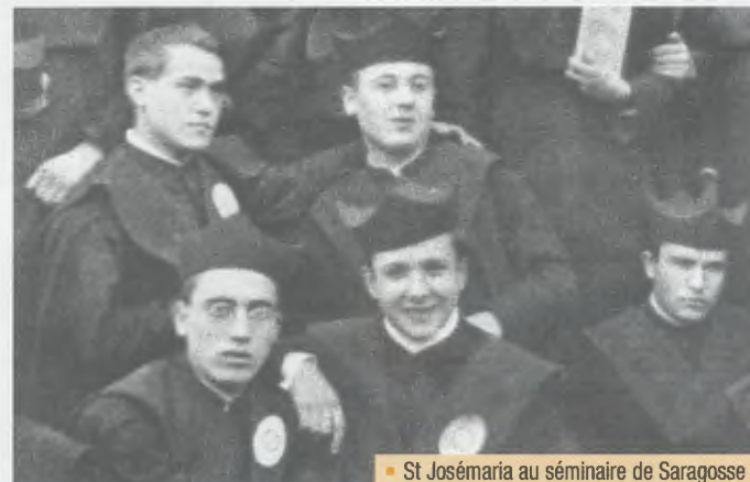
• St Josémária au séminaire de Saragosse

À l'occasion de l'année sacerdotale proclamée par le pape Benoît XVI pour marquer le cent-cinquantième anniversaire de la mort du Curé d'Ars, voici quelques textes de saint Josémária qui pourront nourrir notre prière pour les prêtres et pour les vocations à la prêtrise.