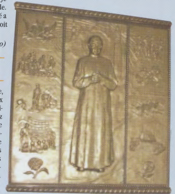
Bas-relief de saint Josémaria installé en août 2009 à l'église de La Napoule (France)