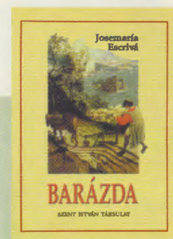
SILLON en hongrois

Texte d'une homélie du 2 mars 1952, publiée dans Quand le Christ passe (Le Laurier, 2 e éd., 1989).