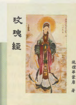
SAINT ROSAIRE en chinois