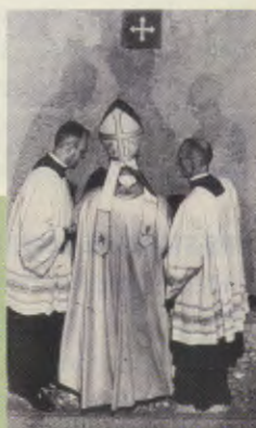
Rome, le 26 décembre 1974. Paul VI dans la basilique devant la Porte sainte.