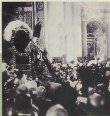
Rome, le 1 er avril 1933. Pie XI, dans sa sedia gestatoria, dans la basilique Saint-Pierre.

+ Xavier Echevarria Prélat de l'Opus Dei