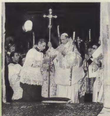
Rome, le 24 décembre 1949. Après avoir ouvert la Porte sainte, Pie XII s'agenouille sur le seuil avant d'entrer dans la basilique.