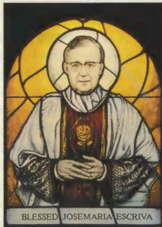
Vitrail de l'église de Hereford, Cardiff, Pays de Gales.

Je devais pour des raisons professionnelles déménager à Paris pour y poursuivre mes études. Or, trois obstacles insurmontables se dressaient devant moi : je devais accomplir mon service militaire, je devais trouver une formation universitaire qui m'accepte comme étudiant et enfin, mes parents n'étant pas disposés à financer ce déménagement, je devais donc trouver de l'argent. Je me suis mis à prier le bienheureux Josémaría en lui confiant cette intention, car j'étais sûr de faire ainsi la volonté du Seigneur. Je l'ai prié d'intercéder pour moi et de m'aider à abattre ces trois obstacles. Je reçus tout d'abord une lettre du ministère de la Défense m'annonçant qu'un sursis supplémentaire m'était accordé (bien que j'avais déjà