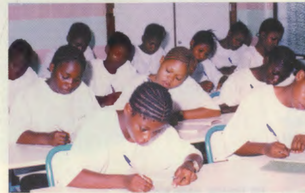
Le cours de couture est une des principales activités du Lycée Professionnel Kimbondo.