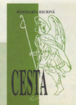
CHEMIN en slovaque