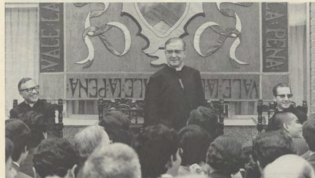
Pendant une réunion au Centre Ciudad Vieja (Guatemala), le 19 février 1975.

En janvier 1975, son état de santé s'était suffisamment amélioré. Comme il l'avait fait l'année précédente, il demanda aux médecins d'évaluer le pour et le contre des déplacements apostoliques qu'il pensait entreprendre en février au Venezuela et au Guatemala.