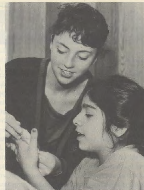
Des centaines de bénévoles viennent chaque semaine se former et aider les élèves.

Metro a commencé ses activités avec 40 élèves pendant un cours d'été qui avait lieu dans un local mis à sa disposition dans un espace commercial. En dix ans, le Centre s'est notablement développé au point qu'aujourd'hui plus de 600 élèves participent aux divers programmes pendant l'année scolaire et les vacances. Dans quelques mois, Metro déménagera dans un nouveau bâtiment, plus vaste, obtenu grâce à la Midtown Educational Foundation , l'institution qui patronne Metro Achievement