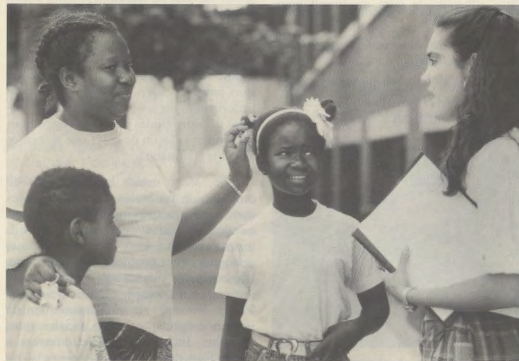
À Metro, on aide les parents à prendre une part active dans l'éducation de leurs filles.

Dans Entretiens , il précisa : la femme est appelée à donner à la famille, à la société civile, à l'Église, ce qui lui est caractéristique, ce qui lui est propre et qu'elle est seule à pouvoir donner : sa tendresse délicate, sa générosité infatigable, son amour du concret, sa finesse d'esprit, sa faculté d'intuition, sa piété profonde, sa ténacité... La féminité n'est pas authentique si la femme ne sait découvrir la beauté de cet