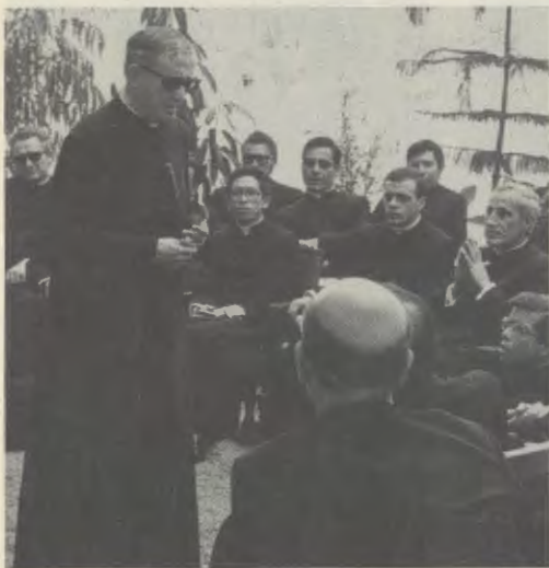
Le bienheureux Josémaría au Guatemala avec un groupe de prêtres diocésains, le 18 février 1975.

On lui prépara un programme intense mais pas trop serré tout de même : sessions de travail, réunions avec des milliers de personnes, pèlerinages dans des sanctuaires mariaux, visites de Centres de l'Opus Dei, rendez-vous avec des personnes et des familles. Néanmoins, comment imaginer que pour une quelconque de ces activités, le