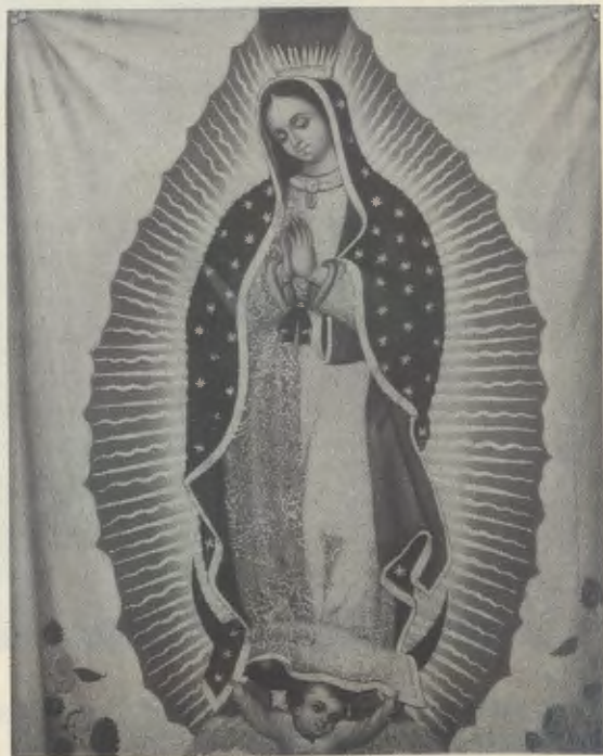
Tableau de la Vierge qui reçut la dernière marque d'amour du bienheureux Josémaria, quelques instants avant de mourir.

Le Saint-Père Jean-Paul II appelle sans trêve tous les chrétiens à une nouvelle évangélisation : c'est une tâche de longue haleine pour l'Église. Mais nous trouvons chez le bienheureux Josémaria un exemple pour nous stimuler, ainsi qu'un intercesseur puissant auquel nous pouvons confier notre désir de conduire au Christ chaque homme, chaque femme, l'humanité tout entière. Comme Mgr Alvaro del Portillo nous le faisait considérer dans l'homélie de la messe qu'il célébra le 21 mai 1992 : « L'élévation sur les autels du bienheureux Josémaria représente comme le début d'une nouvelle extension de la mission ecclésiale pour laquelle le Seigneur l'a choisi. L'universalité de la tâche à laquelle Dieu l'a appelé — annoncer que toutes les réalités terrestres sont un chemin de sainteté — a été soulignée de façon solennelle et tangible. Sa béatification est pour tous les chrétiens un nouvel appel à la sainteté , un nouveau motif d'espérance, un exemple de fidélité et de docilité à Dieu dans l'accomplissement du travail quotidien. »