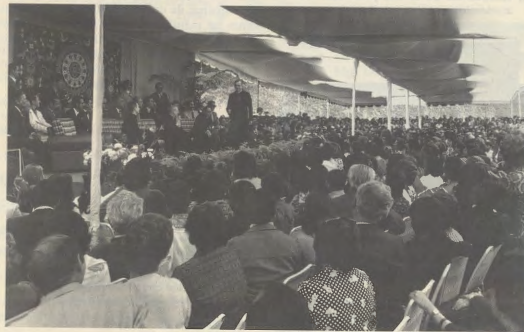
Le fondateur de l'Opus Dei en réunion à Altoclaro (Venezuela), le 9 février 1975.

Ce même jour commencèrent une série de réunions avec des groupes divers. Le 18 au matin, il passa un moment avec des prêtres diocésains. J'ai un grand désir d'acquiescer, leur dit-il avant d'entamer la