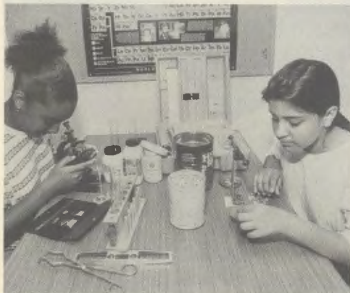
Élèves d'une high-school pendant un cours pratique.

En premier lieu, il s'agit d'encourager l'apprentissage, la formation du caractère et les attitudes chrétiennes de service, et ce