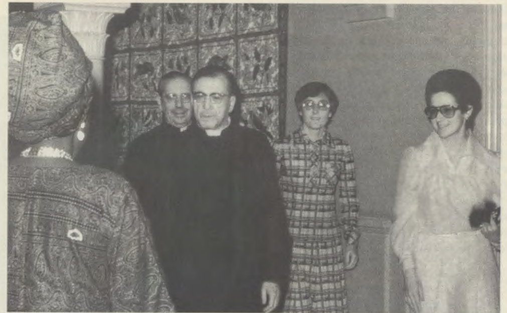
Castelgandolfo. La dernière photo du bienheureux Josémaria, une heure et demie avant son départ pour le ciel.

Son départ fut comme le sceau définitif apposé au chemin de sainteté qu'il avait, sous l'inspiration de Dieu, ouvert dans l'Église en fondant l'Opus Dei le 2 octobre 1928. Grâce à sa prédication, des gens de toutes races et de toutes catégories socio-professionnelles comprirent qu'il est possible de parvenir à la plénitude de la vie chrétienne en convertissant les diverses activités ordinaires de la journée en autant d'occasions de s'unir à Dieu et de servir les âmes. Tout au long de sa vie, jusqu'à ses dernières heures sur terre, le bienheureux confirma par son exemple le message qu'il avait accueilli : fusionner, dans une unité existentielle, le travail, la prière et l'ambition de faire connaître Jésus-Christ ; accomplir ses devoirs quotidiens, le cœur tourné vers Dieu, animé du désir sincère de répandre la lumière du Christ au milieu de tous, hommes et femmes.