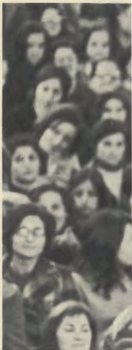
Lors d'une rencontre à Brafa.