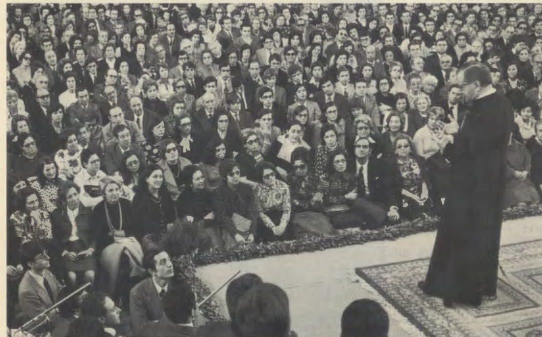
Durant une réunion à Brafa, Barcelone (Espagne), le 22 novembre 1972.

Les experts médicaux qui lui rendirent visite en 1982, au cours du procès canonique, ont déclaré qu'il s'agit d'une guérison complète, et que la maladie ne s'était pas