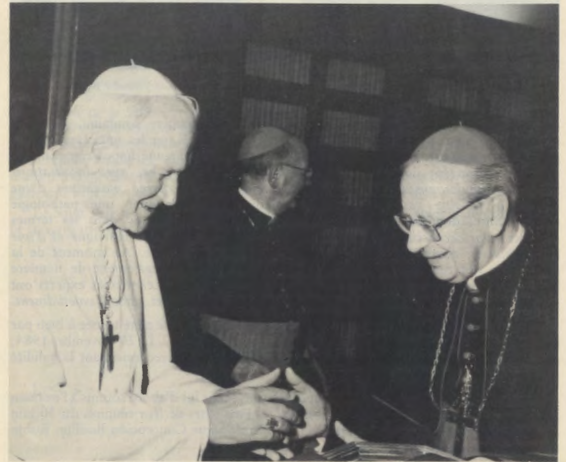
Le Saint-Père, le Cardinal Martínez Somalo et Mgr del Portillo, Prêlat de l'Opus Dei, le 6 juillet 1991, après la lecture du décret.