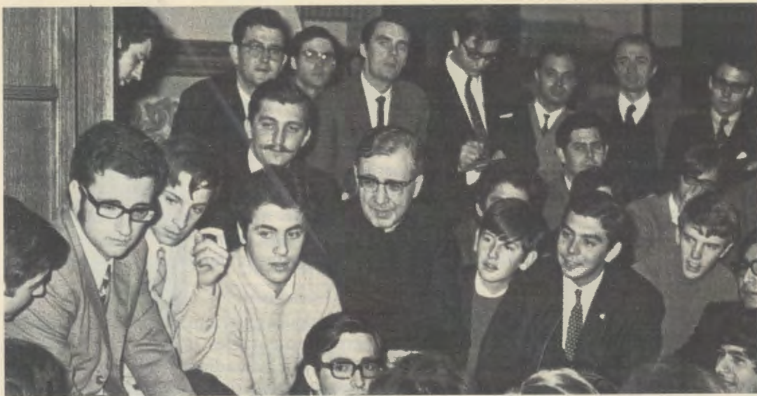
Rome, le 26 mars 1970.