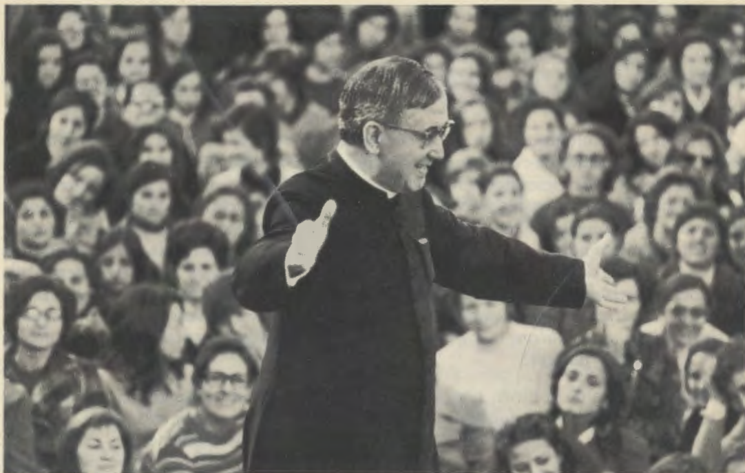
Lors d'une rencontre à Brafa, Barcelone (Espagne), le 25 novembre 1972.

demandes. Et c'est en étroite concomitance avec leurs prières que la guérison intervint subitement.