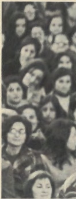
Lors d'une rencontre à Brafo