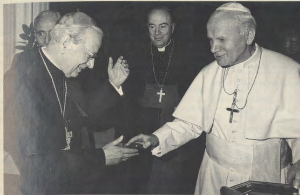
Le Saint Père, le Préfet de la Congrégation des Saints, le Cardinal Felici, et le Prélat de l'Opus Dei Mgr del Portillo, le 9 avril 1990, après la déclaration de l'héroïcité des vertus du Vénérable Josemaría Escrivá.

En 1946 le Serviteur de Dieu s'établit à Rome. En 1947 et en 1950 il obtint l'approbation de l'Opus Dei comme institution de droit pontifical. Avec une charité infatigable et une espérance active, il guida la diffusion de l'Opus Dei dans le monde entier, menant à bien une vaste mobilisation de laïcs conscients de leur propre responsabilité dans la mission de l'Église. Il donna vie à des initiatives d'avant-garde dans l'évangélisation et dans la promotion humaine; il suscita partout des vocations au sacerdoce et à l'état religieux; et il entreprit des voyages exténuants en Europe et en Amérique, où il annonçait avec une foi vigoureuse la doctrine de l'Église. Mais il s'employa avant tout à former les membres de l'Opus Dei, prêtres et laïcs, hommes et femmes, à une vie intérieure solide et à un zèle ardent, se manifestant