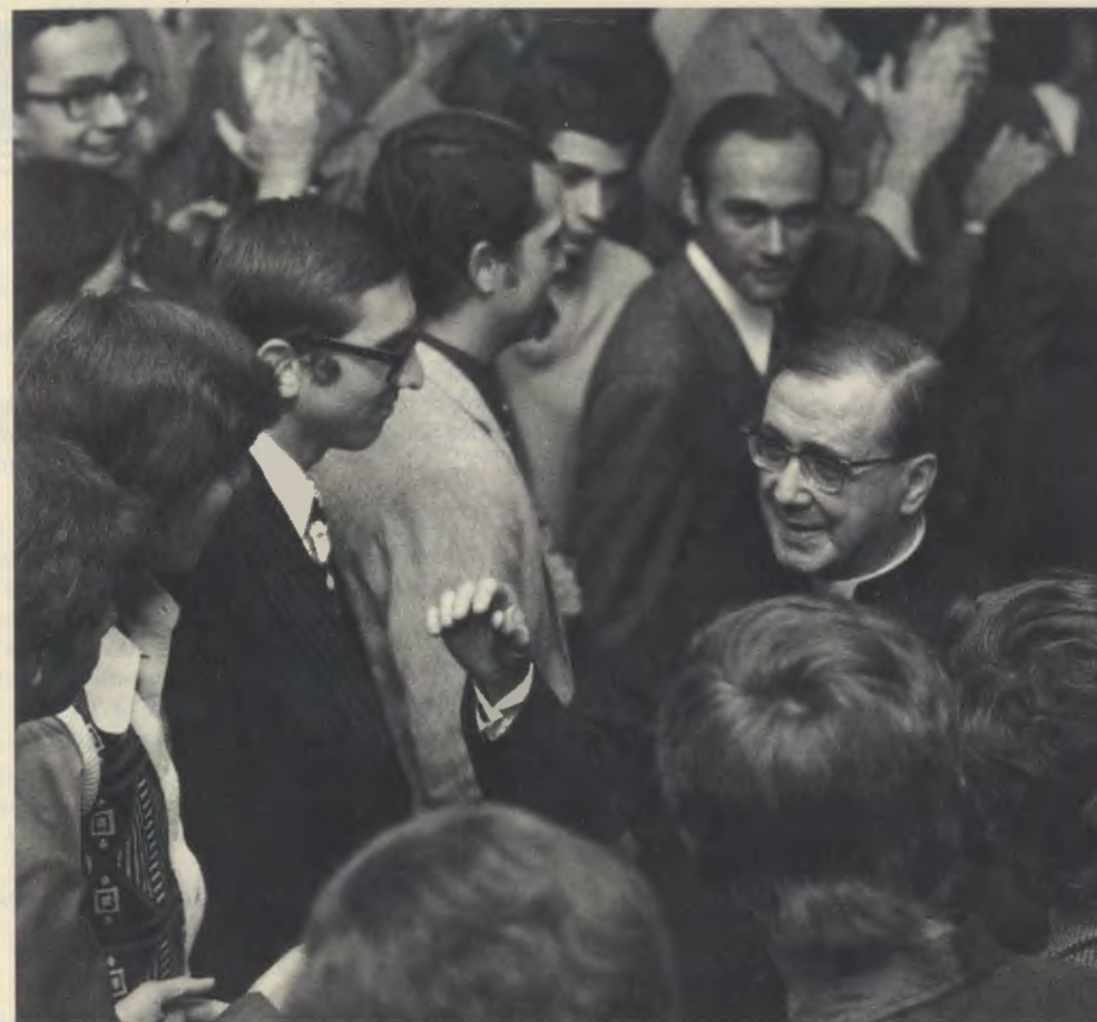
1974, São Paulo (Brésil).

Depuis la fondation de l'Opus Dei, il a rendu à l'Eglise des services insignes, plein d'amour et de persévérance » (AGP, RHF P-00644, Lettre au Saint Père, Osaka, le 27-VII-1975).