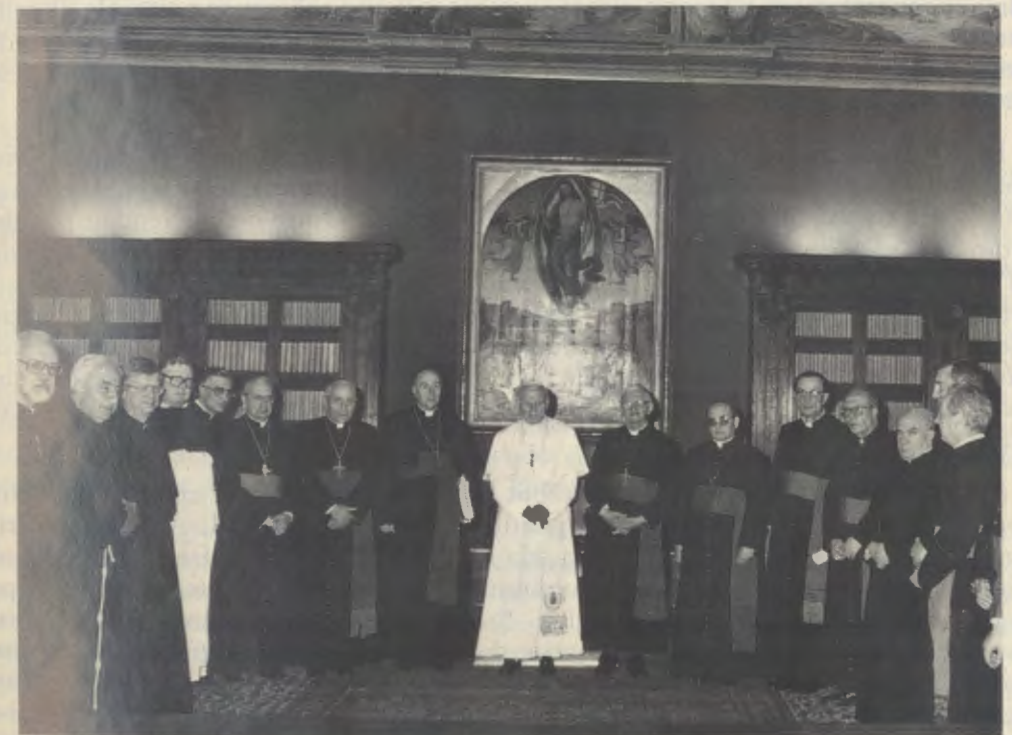
Le 9 avril 1990. Après la lecture du Décret sur les vertus héroïques du Vénérable Josemaría Escrivá.