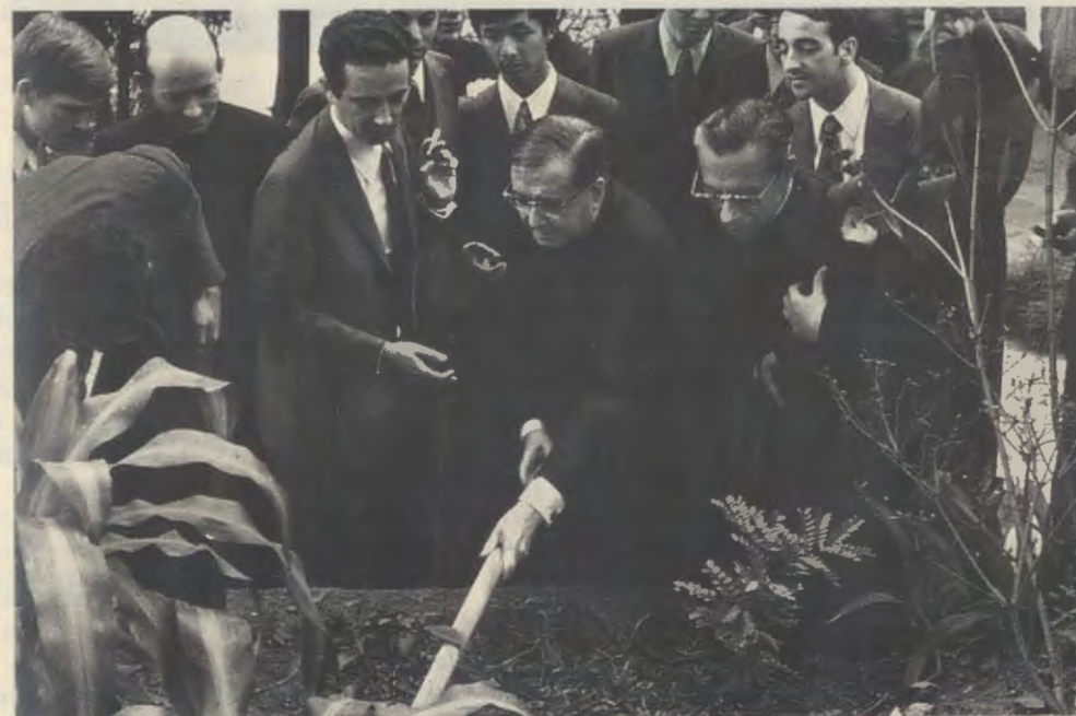
1974, Brésil, Sitio de Aroeira.

« Tous ceux qui ont eu le privilège de faire sa connaissance peuvent témoigner que, lorsqu'il est mort en 1975, à l'âge de 73 ans, il était encore très jeune. Il n'avait pas vieilli au fil des années. Au contraire, son esprit devenait chaque année plus jeune, ce qui lui donnait une incroyable vitalité de jeunesse et de joie. Tout cela ne venait pas sans effort, mais était précisément le résultat de toute une vie de lutte héroïque qui l'a amené à s'unir chaque jour davantage au Seigneur » ( Opus dei in Africa : a force for good , dans "Sunday Nation", Nairobi, le 3-II-1980).