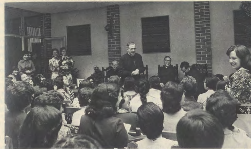
Guatemala, 1975, dans un Centre pour la formation de la femme.

Autres livres de Mgr Escrivá en réédition, actuellement non disponibles : Amis de Dieu (disponible en 1990) Je désire être tenu au courant de vos publications.